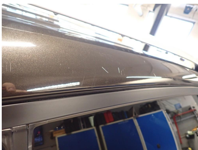
1.1 Noe slitt i lakk