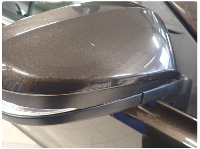
1.1 Noe slitt i lakk