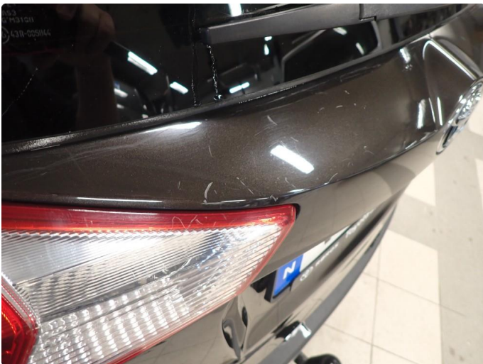
1.1 Noe slitt i lakk