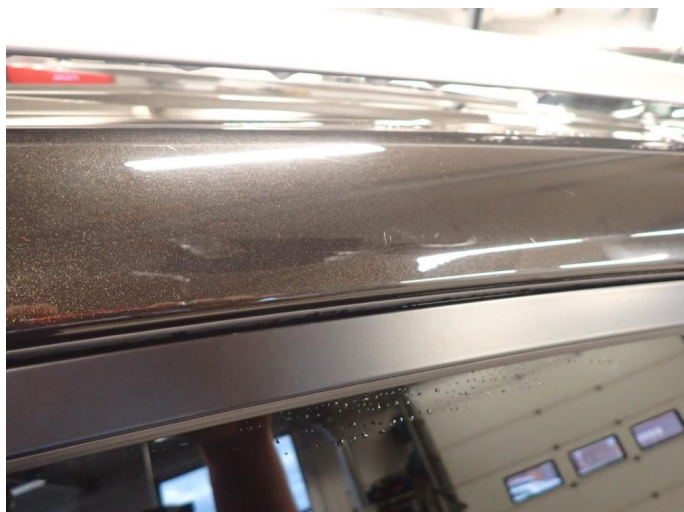
1.1 Noe slitt i lakk