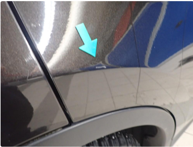
1.1 Noe slitt i lakk