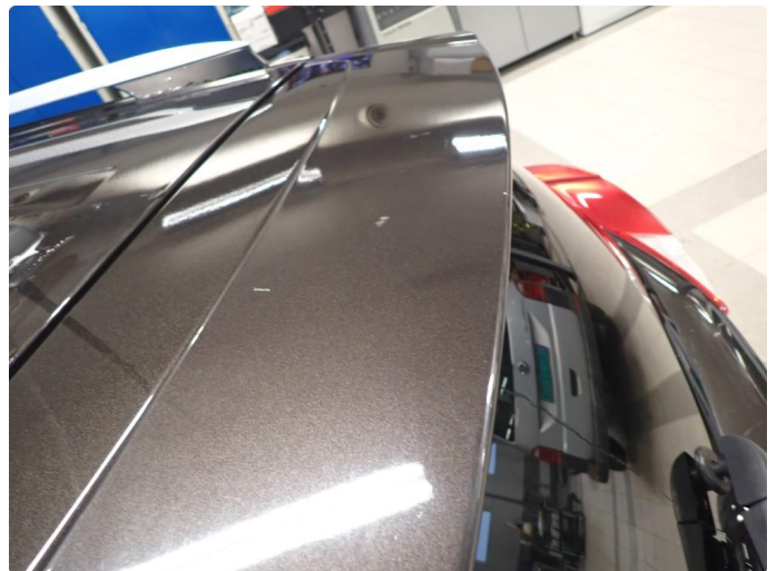
1.1 Noe slitt i lakk