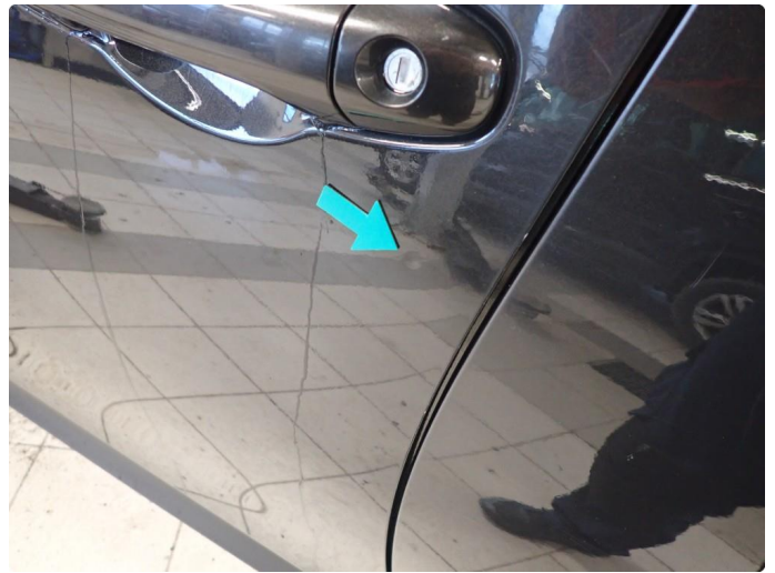
1.1 Noe slitt i lakk