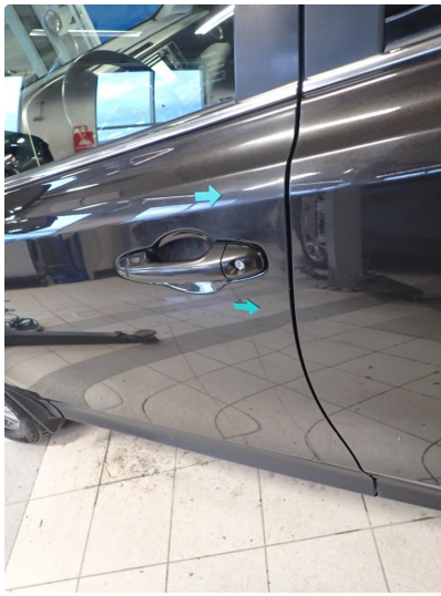
1.1 Noe slitt i lakk