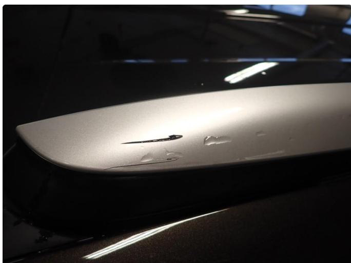
1.1 Noe slitt i lakk