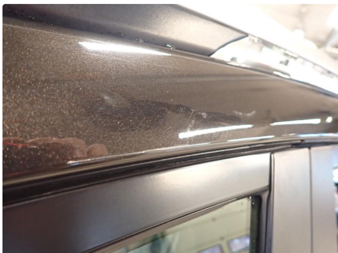
1.1 Noe slitt i lakk