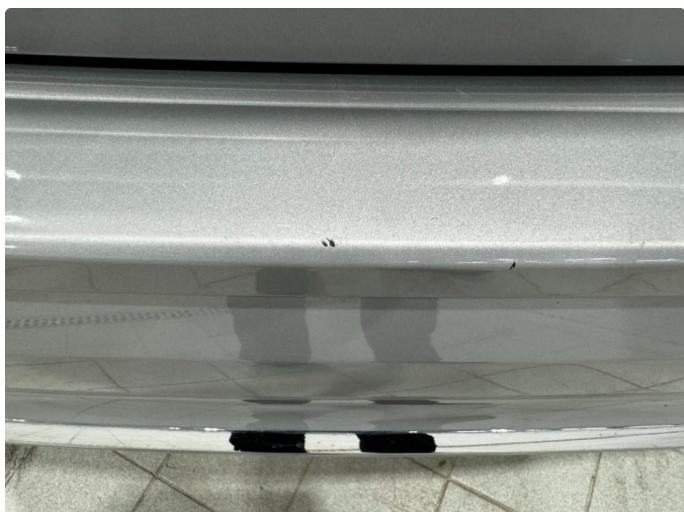
1.2 Liten lakkskade. Blir fikset