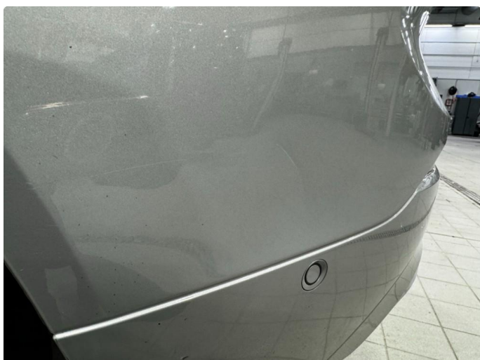
1.2 Liten lakkskade. Blir fikset