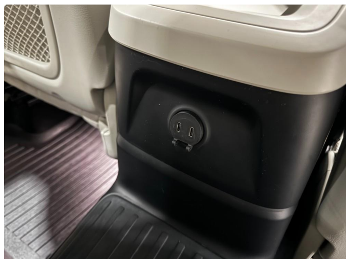
3.1 Øvrige feil