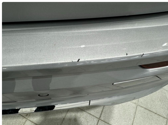
1.2 Liten lakkskade. Blir fikset