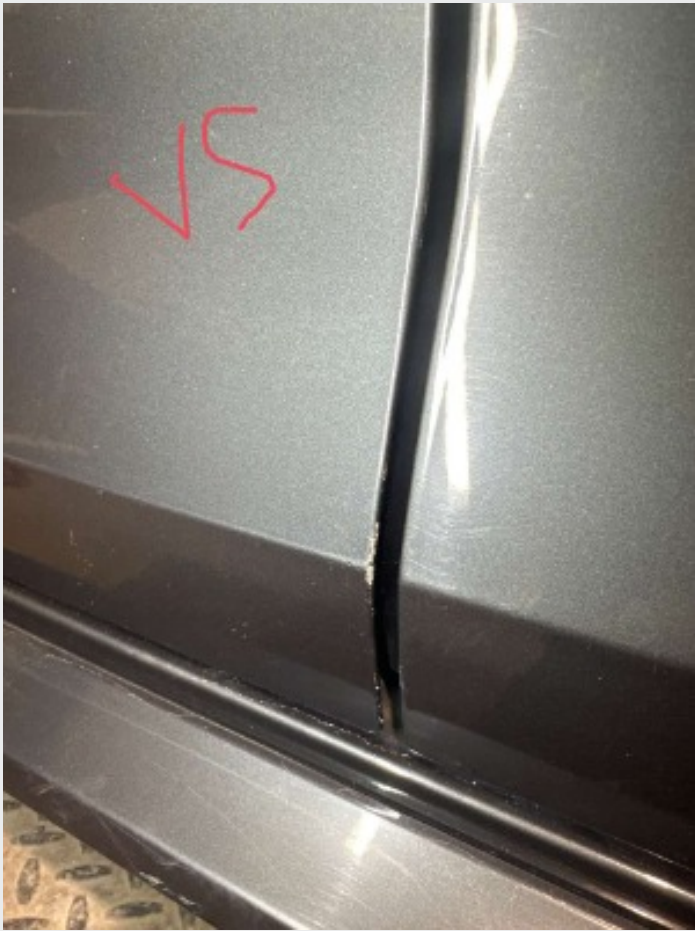
2.5 lakkskade førerdør(vedlegg)