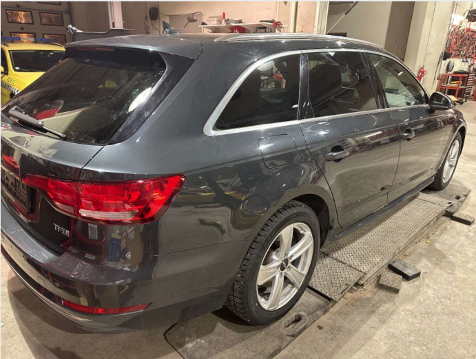
2.1 oversiktsbilder av bilen