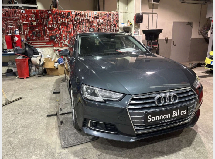
2.1 oversiktsbilder av bilen