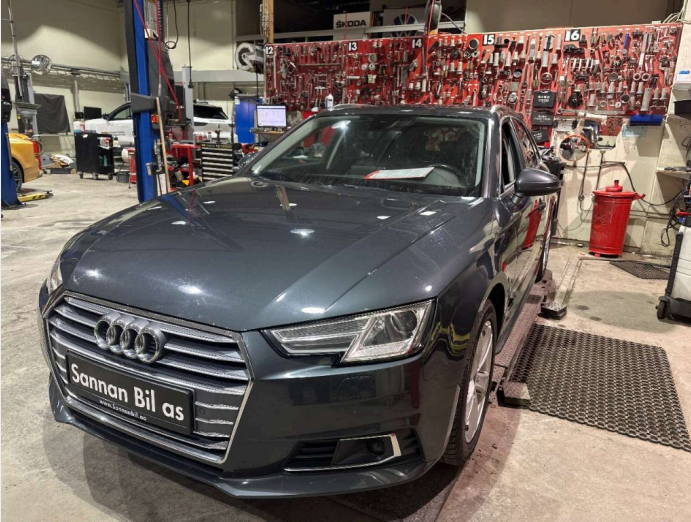
2.1 oversiktsbilder av bilen