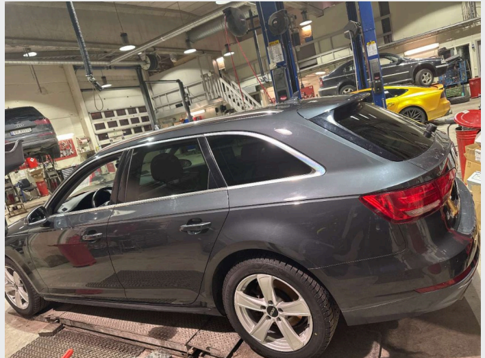
2.1 oversiktsbilder av bilen