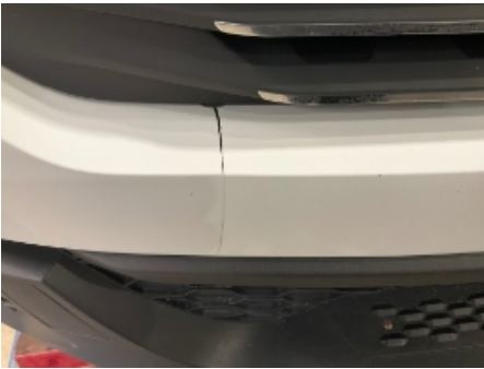
1. Lakk / karosseri utvendig