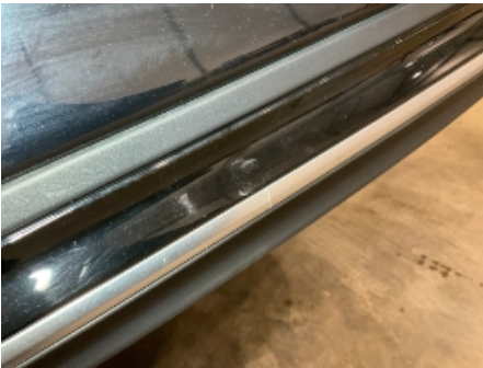
1. Lakk / karosseri utvendig