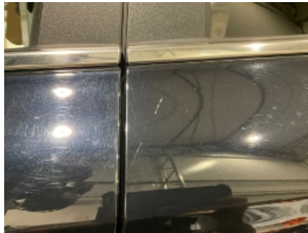
2. Lakk / karosseri utvendig