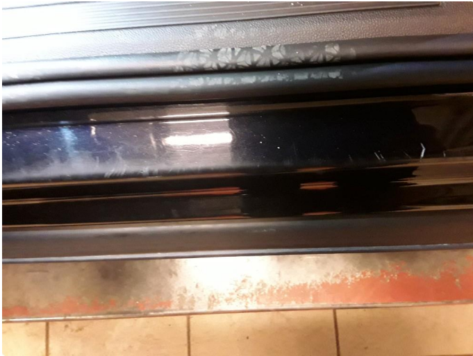
1.4 Noe riper.