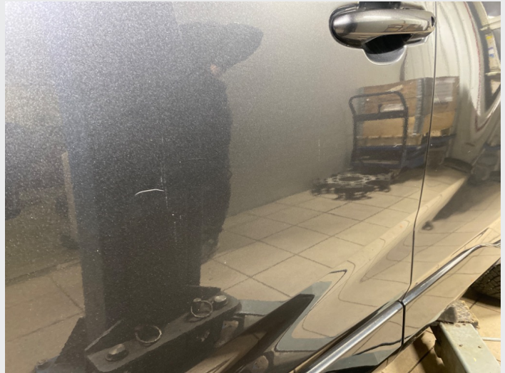
2.5 Striper førerdør og venstre bakdør, liten bulk i stripa på førerdør