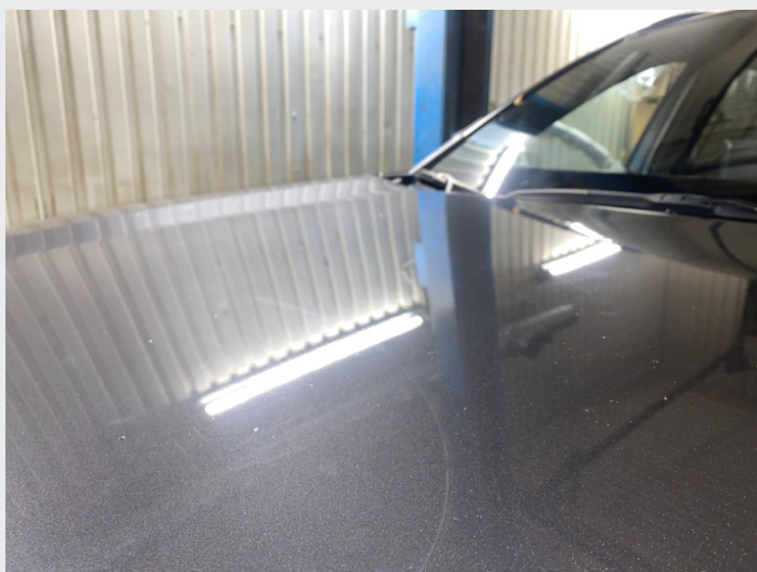
2.3 Mye striper panser