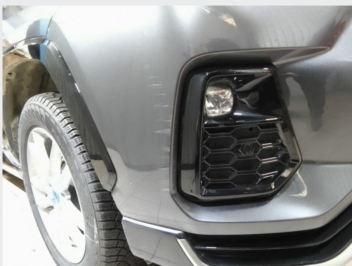
2.8 Skade/striper høyre foran