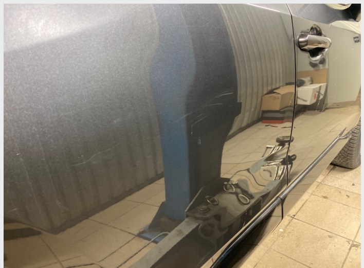
2.5 Striper høyre bakdør