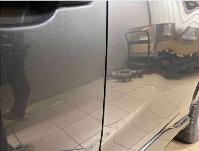
2.5 Striper førerdør og venstre bakdør, liten bulk i stripa på førerdør