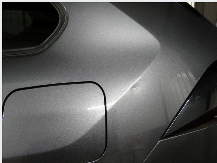
2.7 Bulk venstre bakskjerm