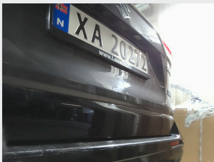
2.5 Bulk bakluke