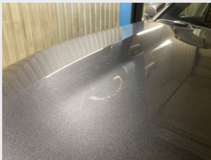
2.3 Mye striper panser