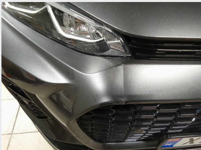
2.8 Skade front