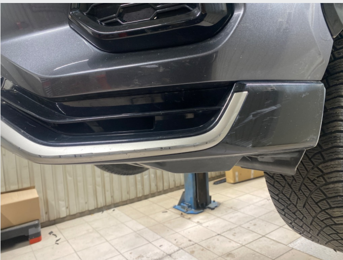
2.8 Oppstripet venstre foran