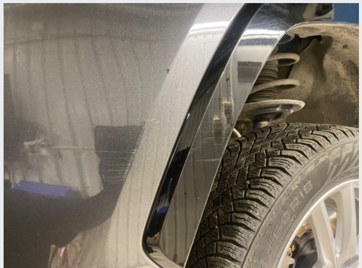
2.8 Oppstripet venstre foran