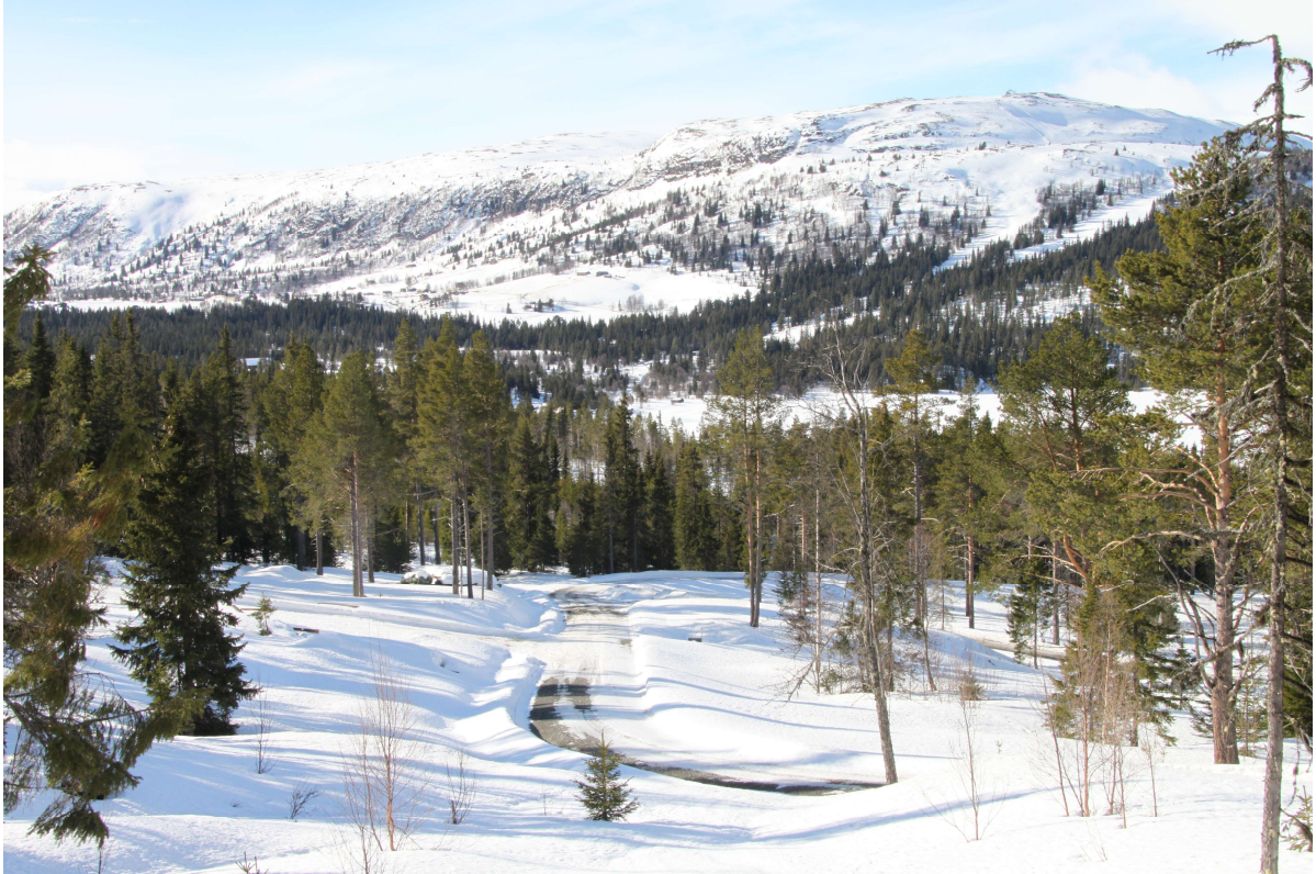
Utsikt mot Valsfjell