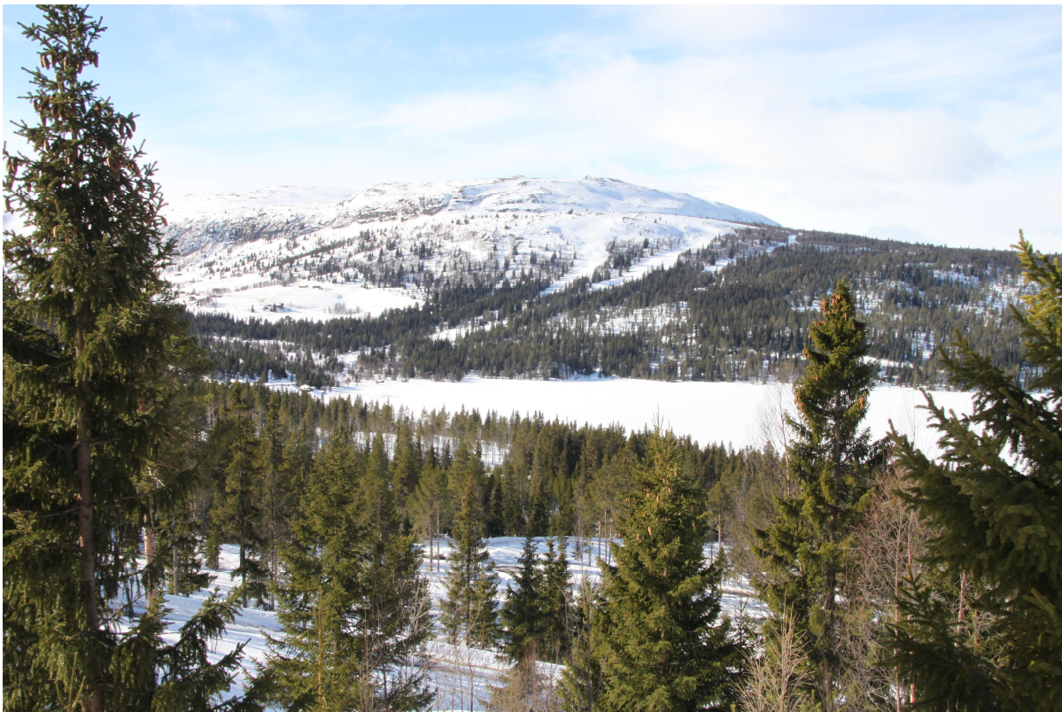
Utsikt mot Gålåvatnet og Valsfjell