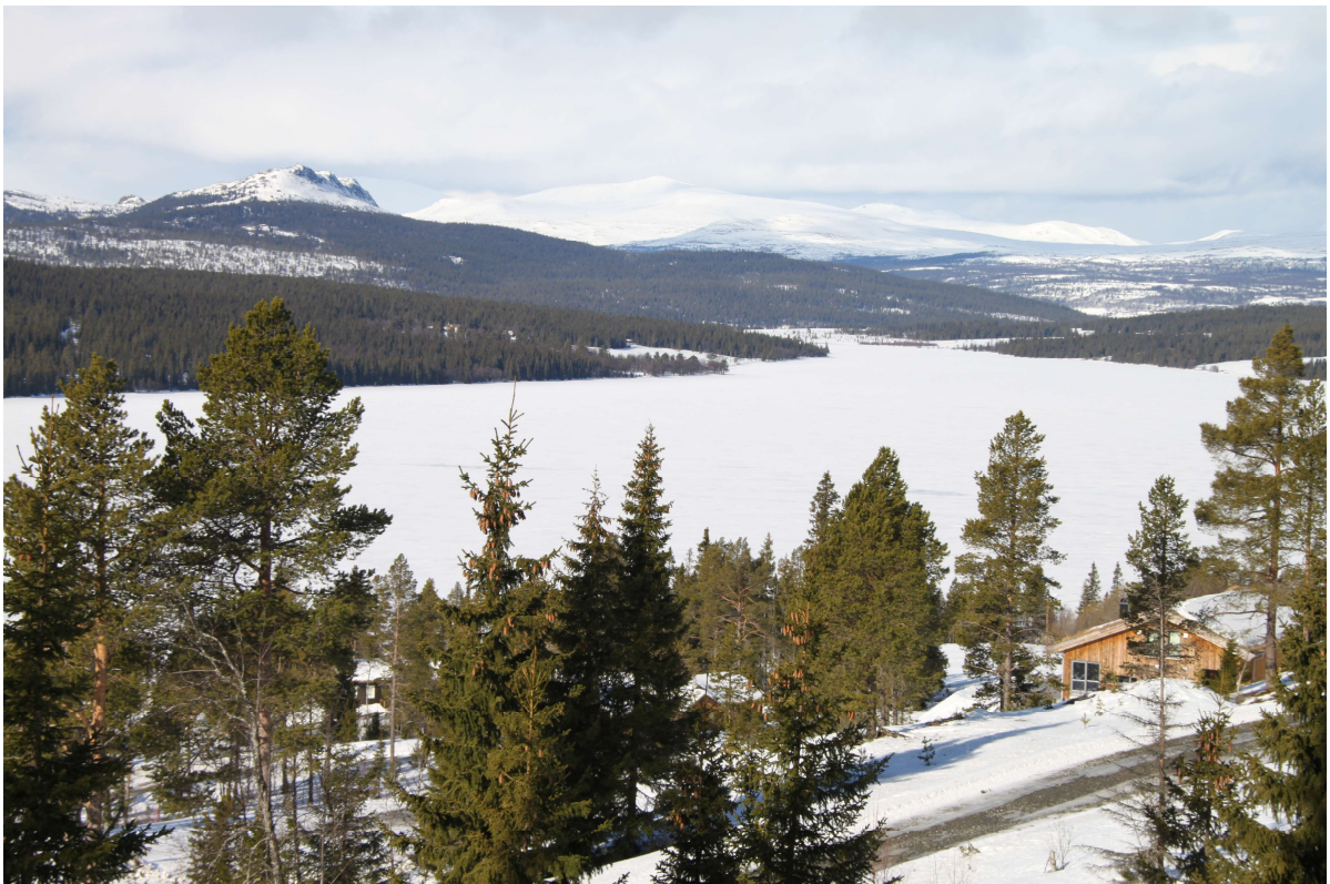
Utsikt mot Gålåvatnet, Jotunheimen og Feforkampen