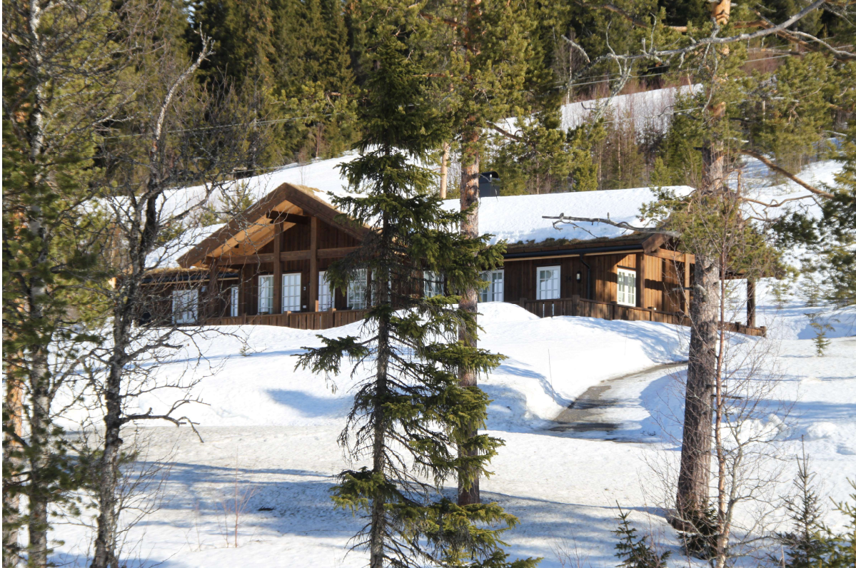
Hytte i tomtefeltet