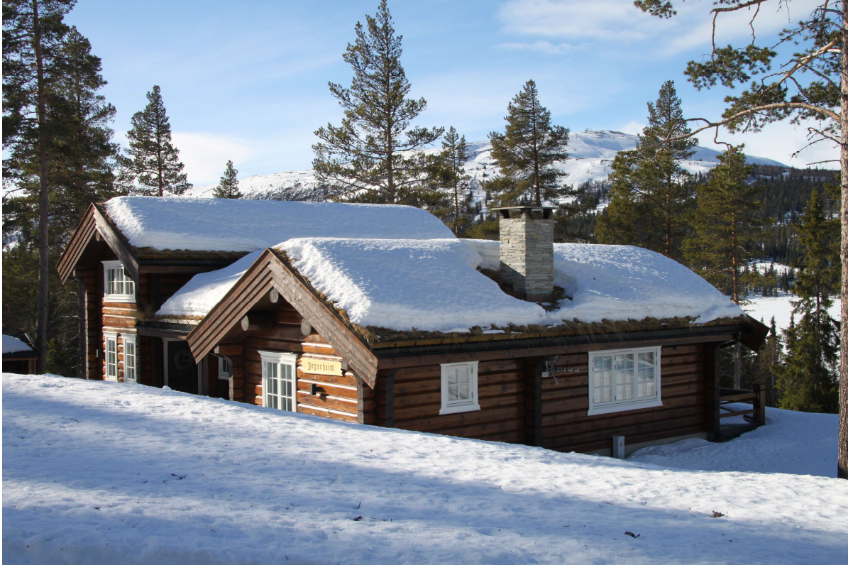
Hytte i tomtefeltet