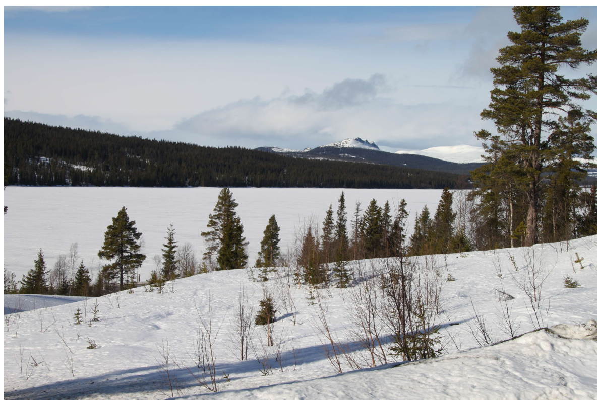
Utsikt mot Gålåvatnet og Feforkampen