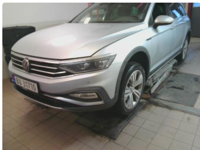
2.1 Bilder av bilen