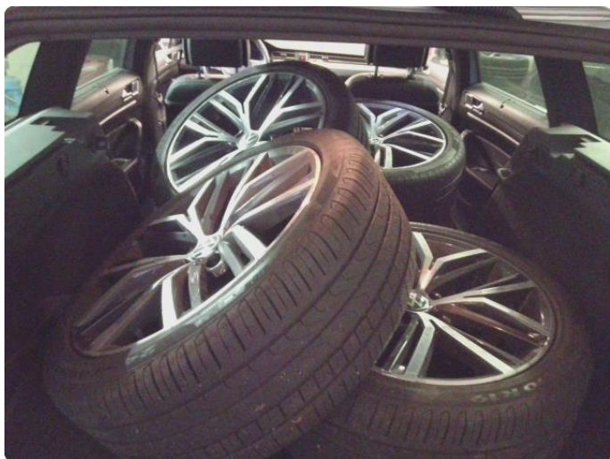
2.1 Bilder av bilen