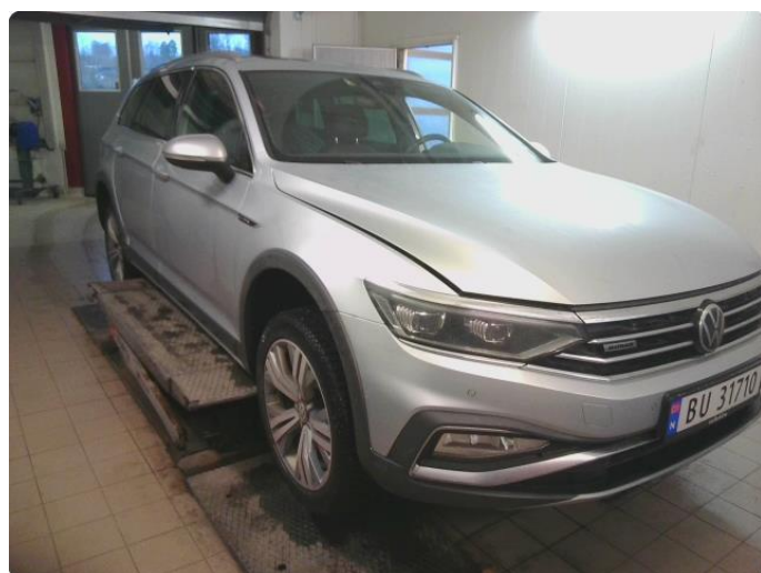
2.1 Bilder av bilen