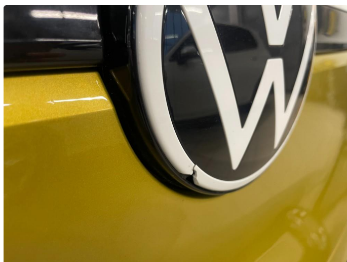
2.4 Liten skade emblem