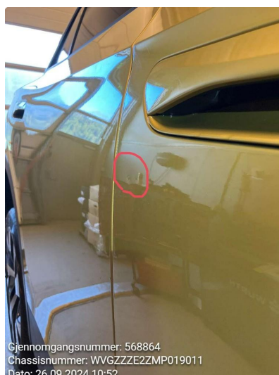
2.1 Liten p-bulk