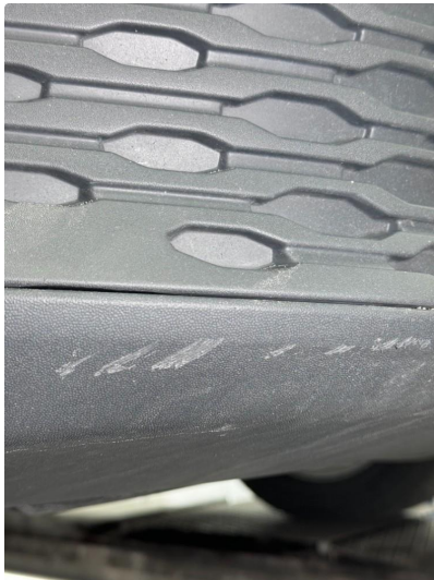
1.5 Noe riper.