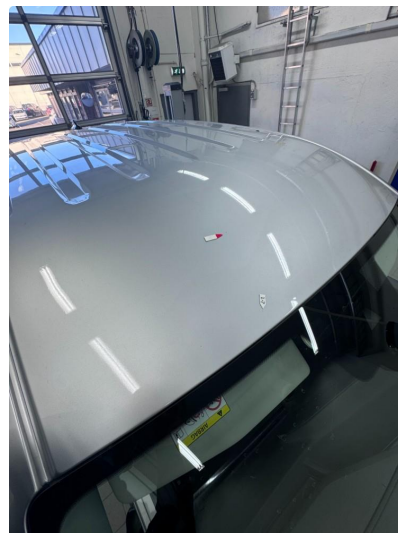
1.6 Steinsprut med korrosjon.