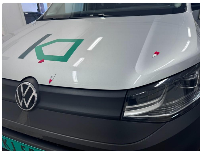
1.2 Noe riper og steinsprut.