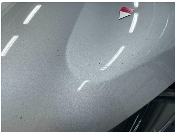
1.2 Noe riper og steinsprut.