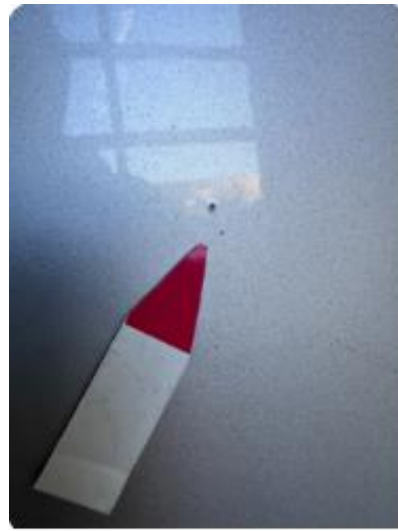
1.4 Steinsprut med korrosjon.