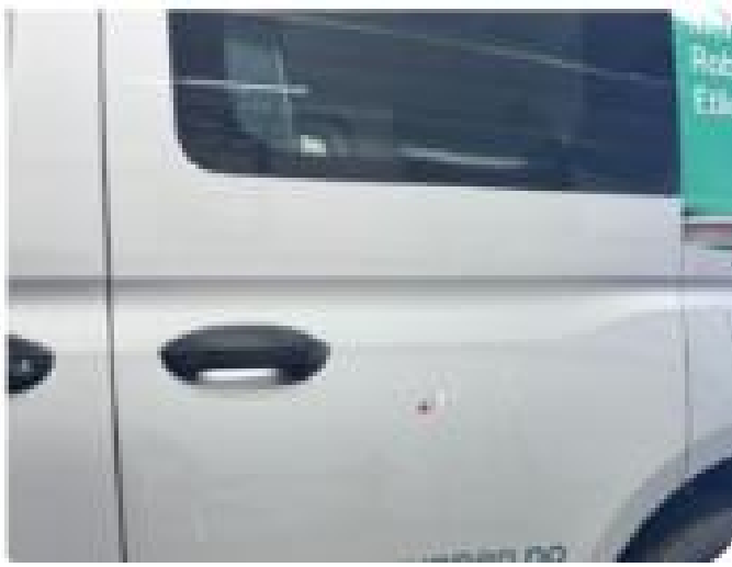
1.3 Steinsprut med korrosjon venstre bak.