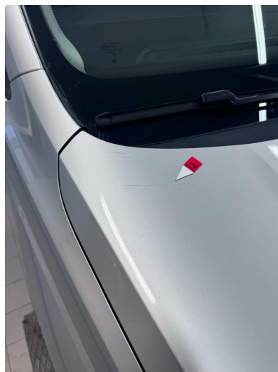
1.2 Noe riper og steinsprut.