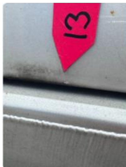
1.3 Steinsprut med korrosjon venstre bak.