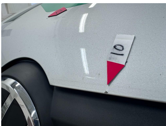
1.2 Noe riper og steinsprut.