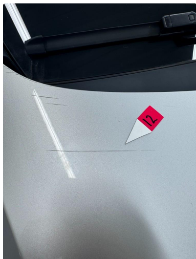
1.2 Noe riper og steinsprut.