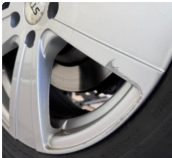
1.3 2 noe kantkjørte vinterfelger.