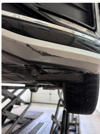
1.4 Noe riper nedre del venstre og høyre side.