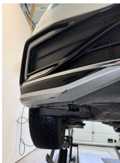
1.4 Noe riper nedre del venstre og høyre side.