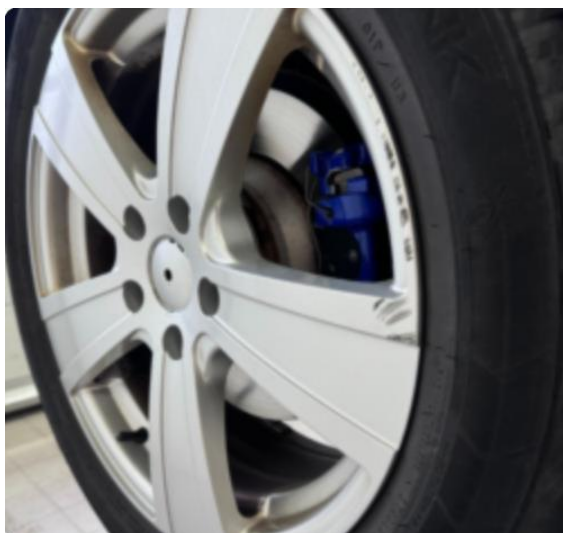
1.3 2 noe kantkjørte vinterfelger.