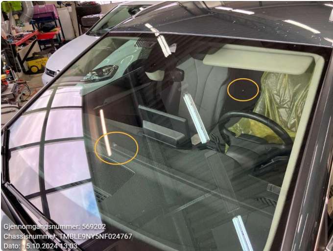
1.1 To små steinsprut - limt