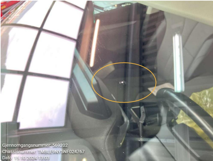
1.1 To små steinsprut - limt