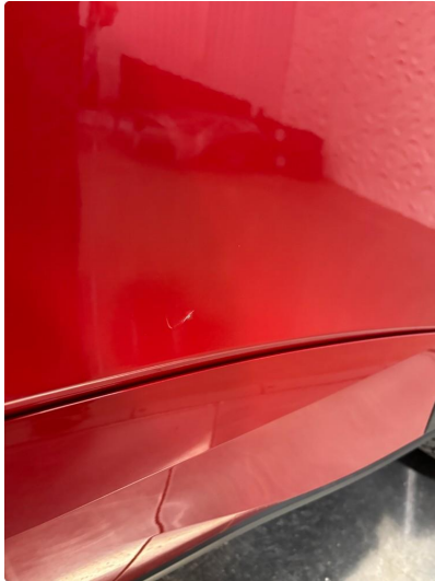
1.1 Ripe i dør venstre bak