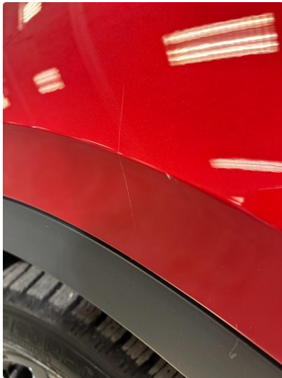
1.2 Liten ripe i framskjerm venstre + høyre bak