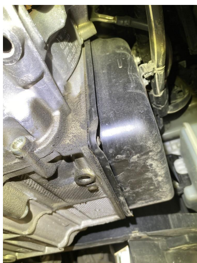
2.2 Oljelekkasje mellom motor/gear