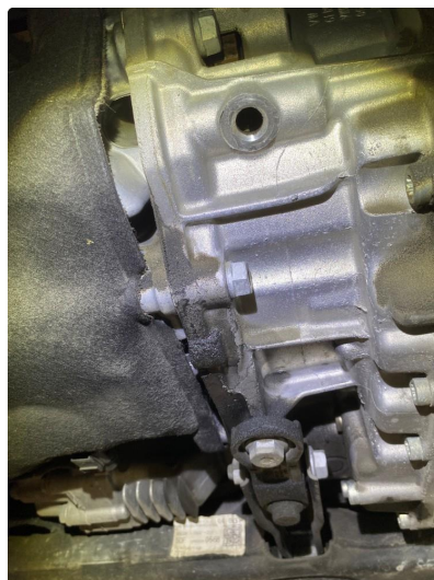
2.2 Oljelekkasje mellom motor/gear