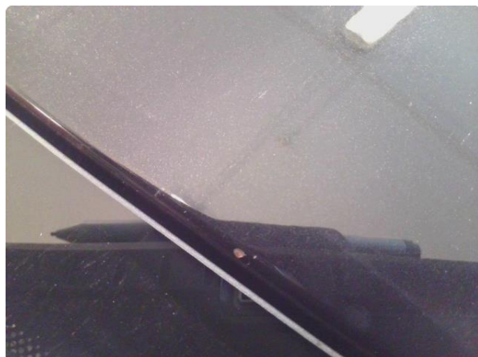
1.2 Stensprut med rust