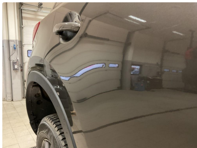
1.3 Liten ubetydelig bult h/bakdør