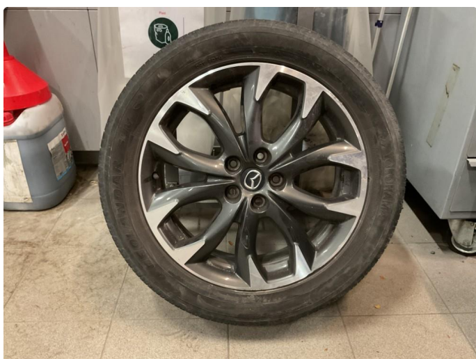
1.4 1 sommerfelg er noe kantkjørt