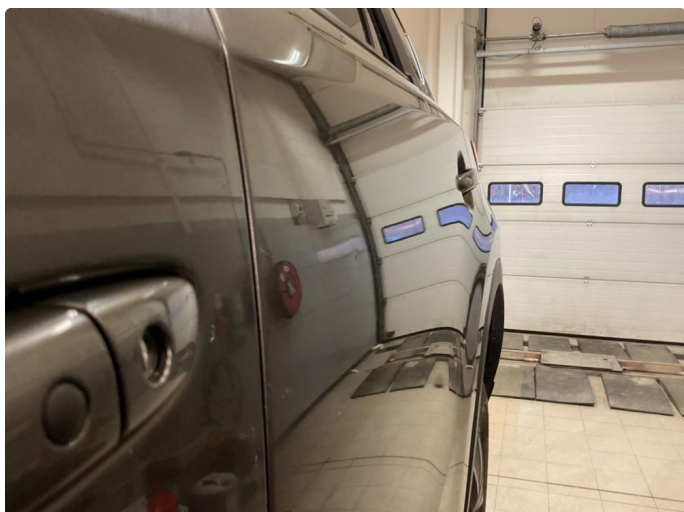
1.2 Liten ubetydelig parkeringsbult v/bakdør