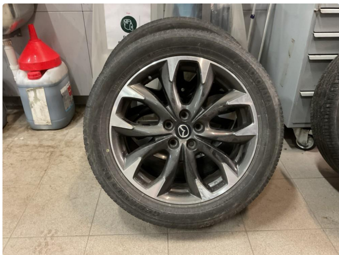
1.4 1 sommerfelg er noe kantkjørt