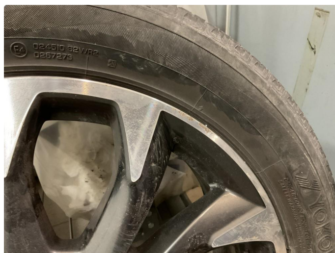
1.4 1 sommerfelg er noe kantkjørt