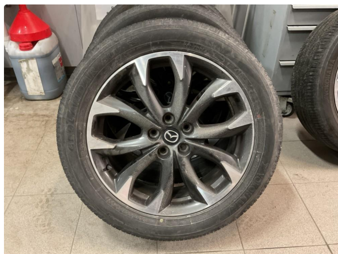
1.4 1 sommerfelg er noe kantkjørt