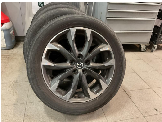
1.4 1 sommerfelg er noe kantkjørt