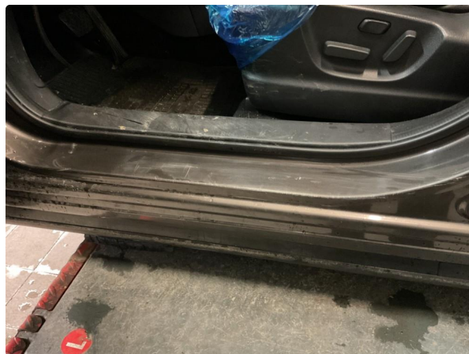
1.5 Små riper/bulker i døråpning førerside