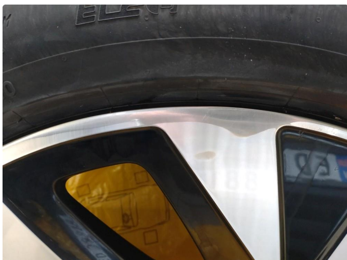
1.3 Ripe (r) gjennom lakk