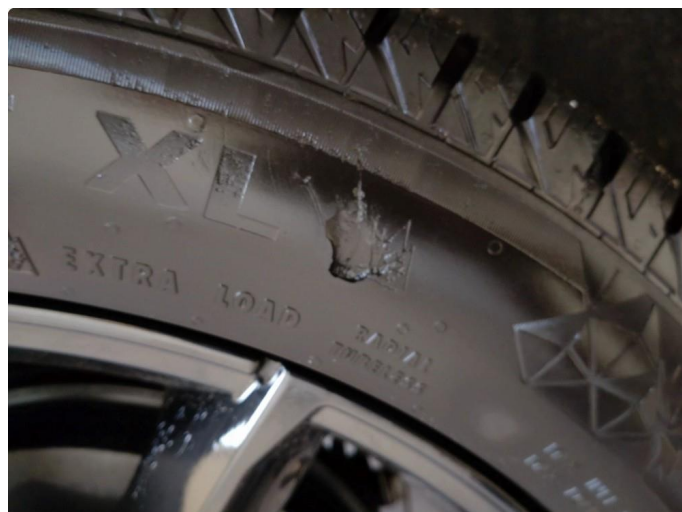
1.2 Dekkskade vinterhjul