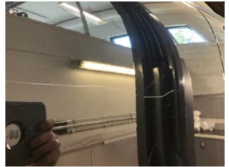
3. Lakk / karosseri utvendig