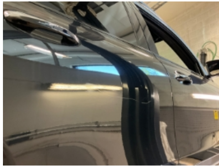
2. Lakk / karosseri utvendig