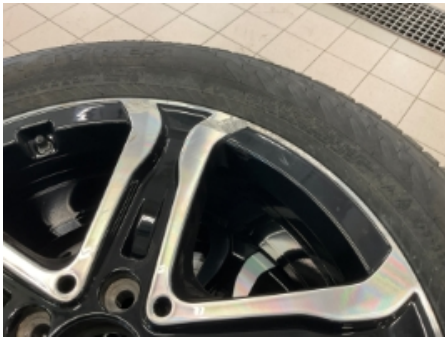
1. Ekstra hjulsett