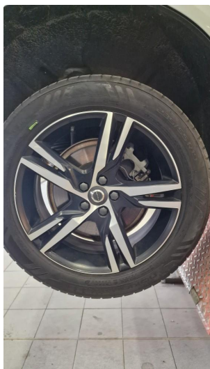
1.1 Lite merke i høyre bakfelg på sommerhjulene