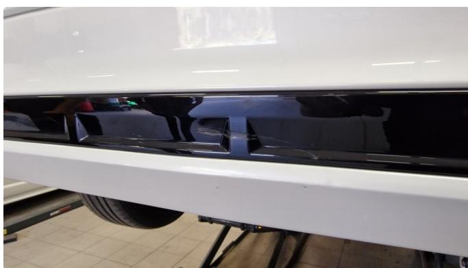
1.2 Lite merke på defuser midt på bakfanger