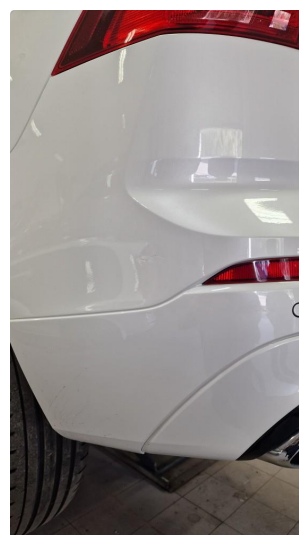
1.3 Lagt i lakk i et bitte lite merk på siden på støtfangeren bak