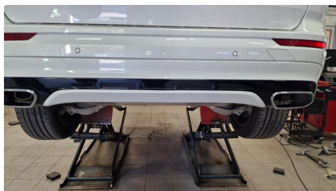
1.2 Lite merke på defuser midt på bakfanger