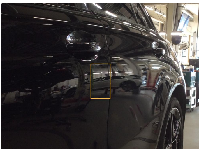
1.1 Lite synlig bulk uten lakkskade