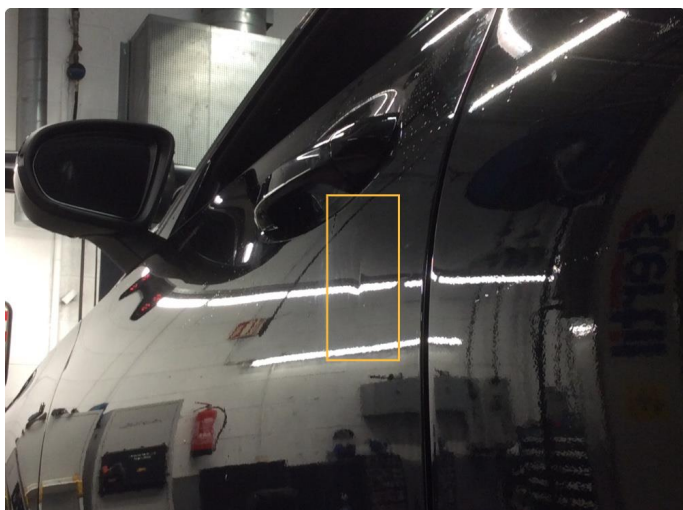
1.1 Lite synlig bulk uten lakkskade