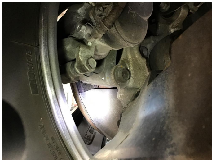
4.2 Mer enn 25% rust