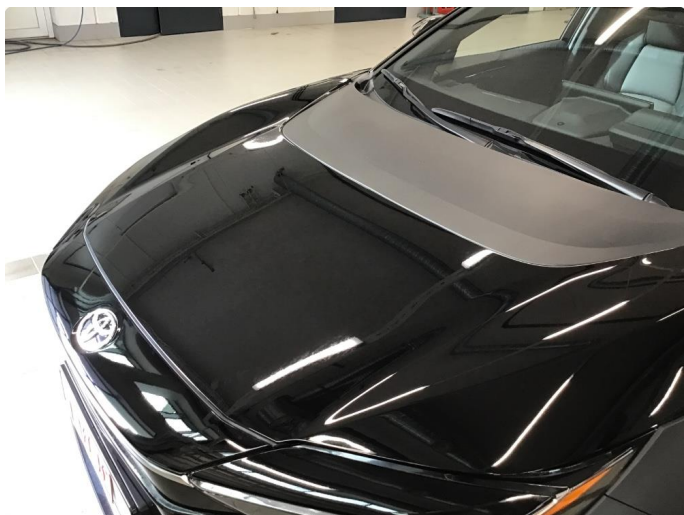
6.1 Fjerne dekor/logo