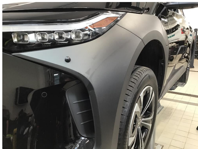
2.7 Skjermtutbygger skadet