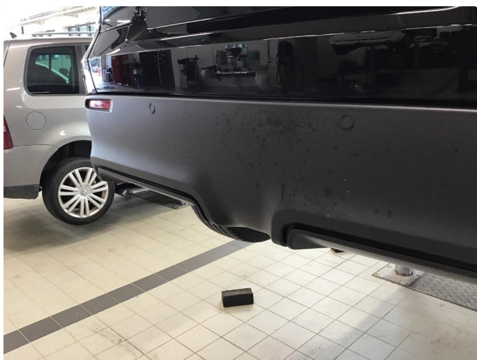
2.8 Øvrige feil