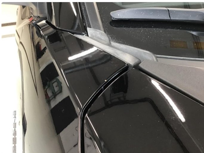
2.6 Steinsprut med rust