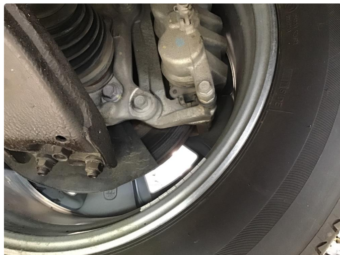
4.1 Mer enn 25% rust