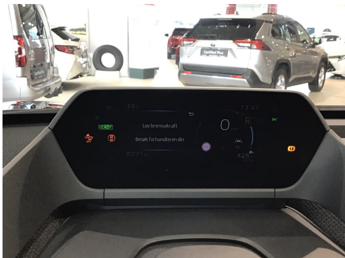
1.1 Varsellampe lyser se bilde