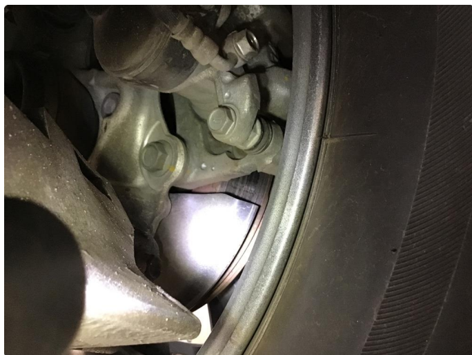
4.2 Mer enn 25% rust