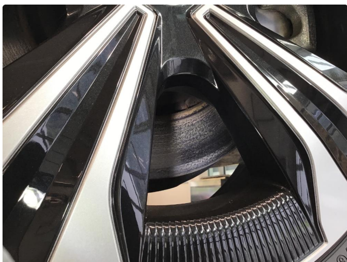
4.3 Mer enn 25% rust