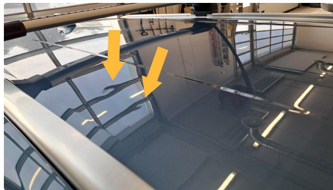
1.12 Bulker og steinsprut med rust.