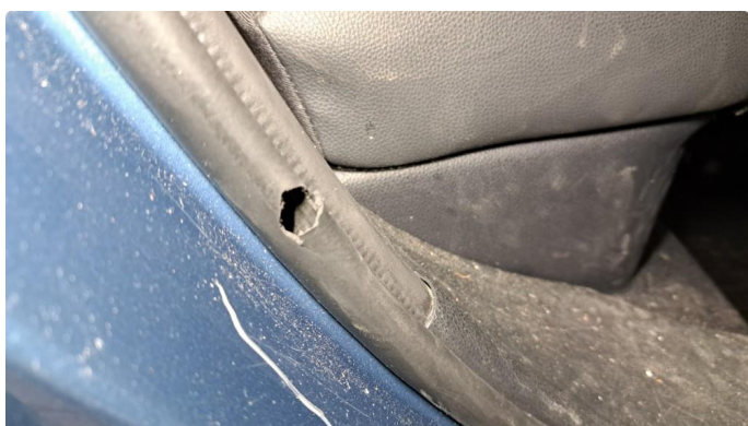
1.8 Rift i pakning