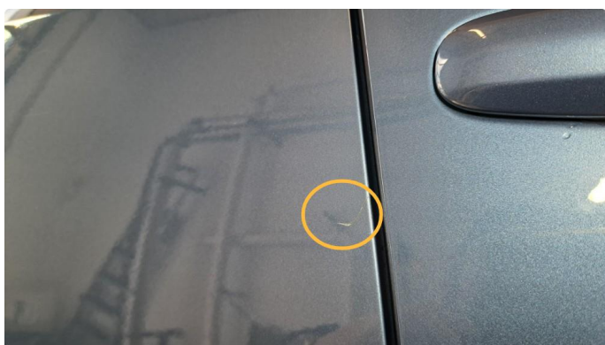
1.2 Bulk og ripe