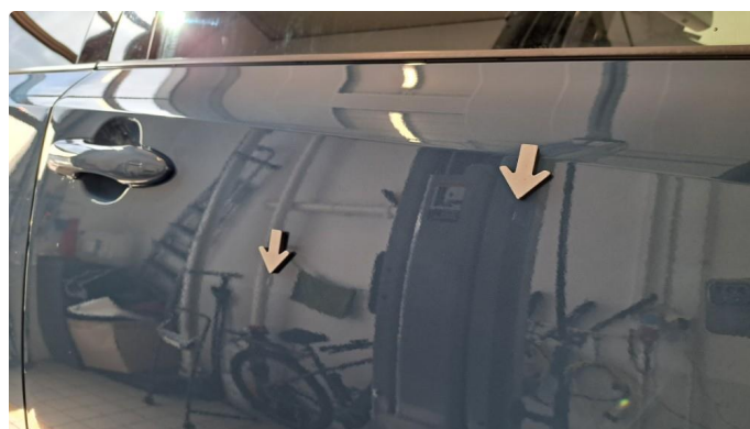
1.3 Små bulker