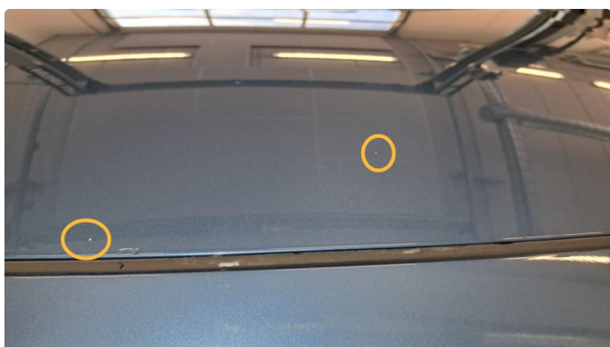
1.1 Små steinsprut