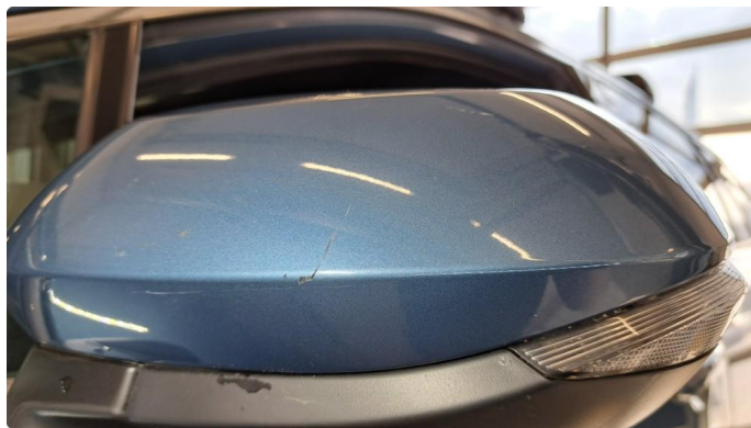
1.7 Riper i speildeksel