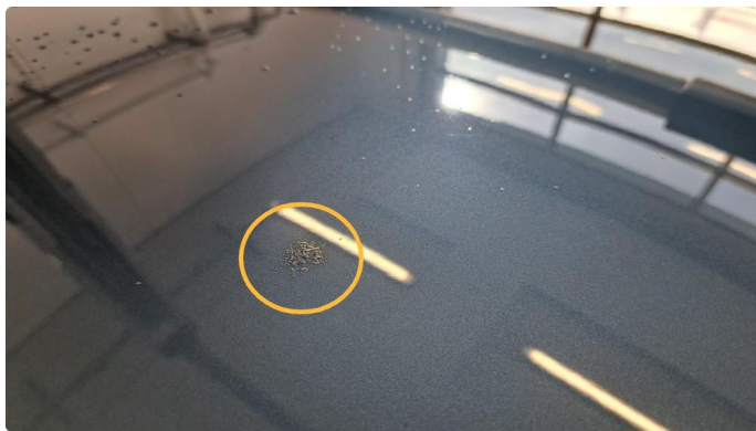
1.12 Bulker og steinsprut med rust.