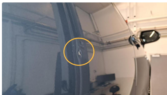
1.2 Bulk og ripe