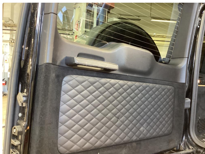
2.2 Skadet/merker etter utstyr