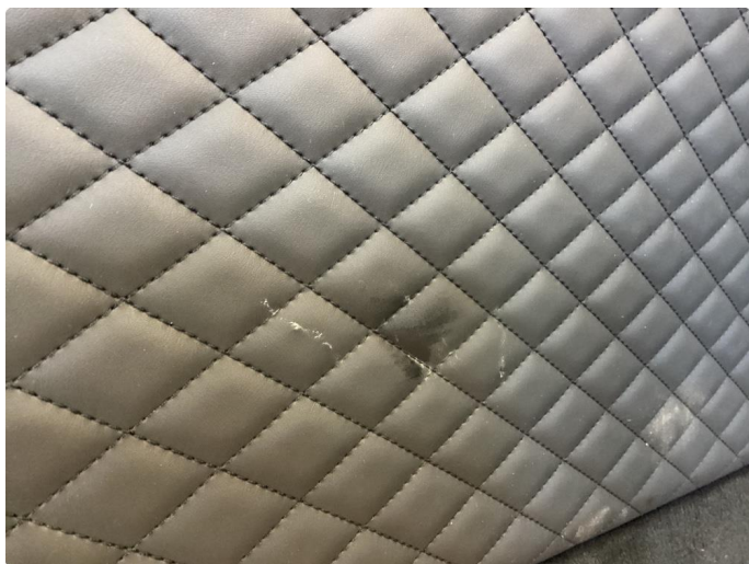
2.2 Skadet/merker etter utstyr