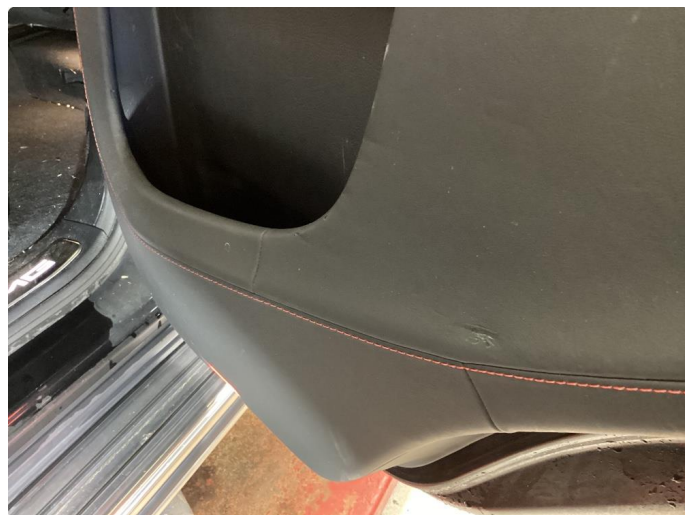
2.3 Skadet/merker etter utstyr