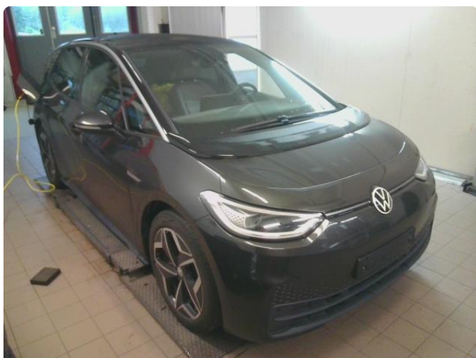
1.1 Øvrig opplysninger