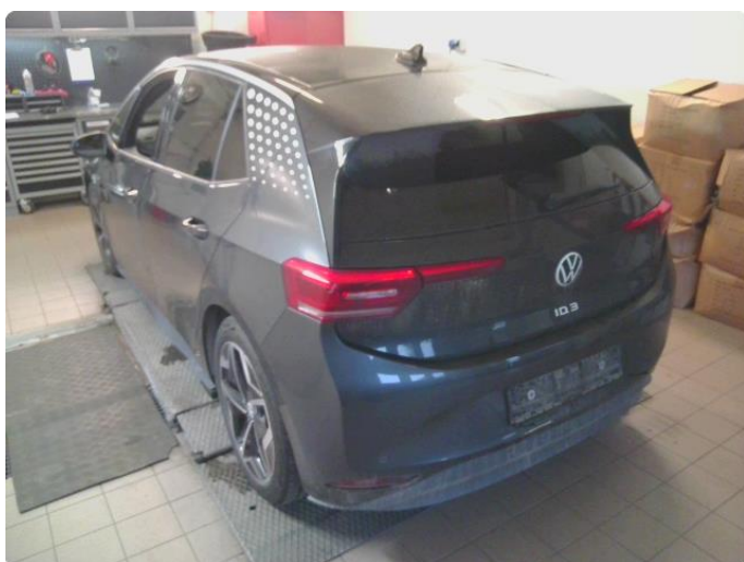
1.1 Øvrig opplysninger