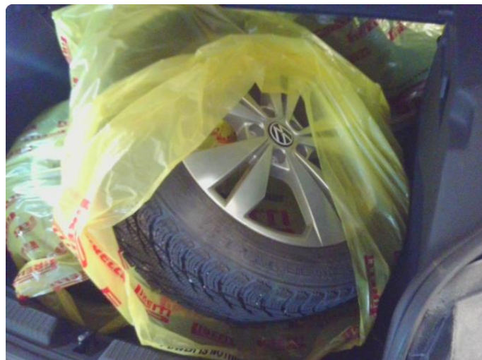
1.1 Øvrig opplysninger