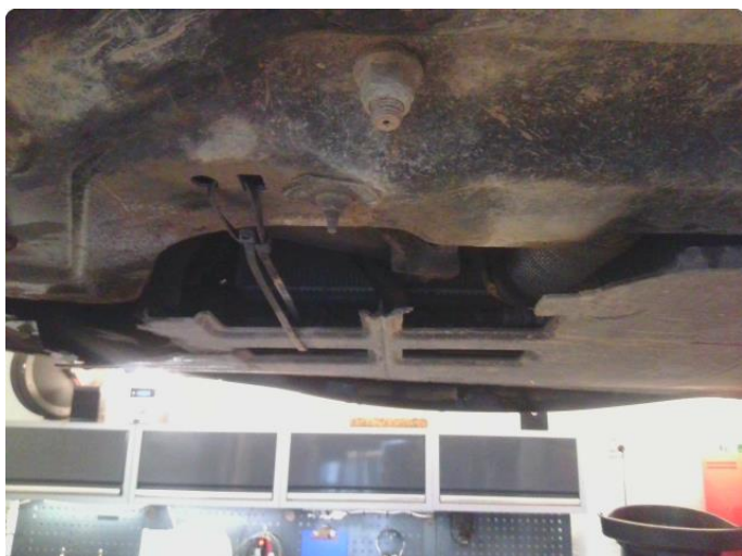
2.1 Beskyttelsesplate skadet/mangler