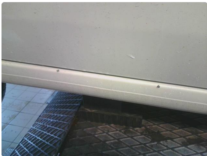
2.12 Lakk flasser