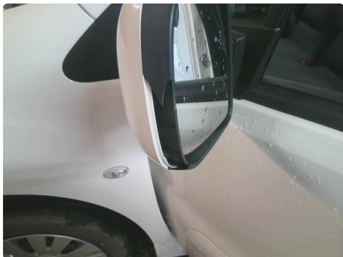
2.9 Deksel skadet/ripe