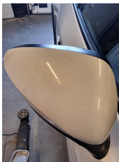
1.6 Deksel skadet/ripe