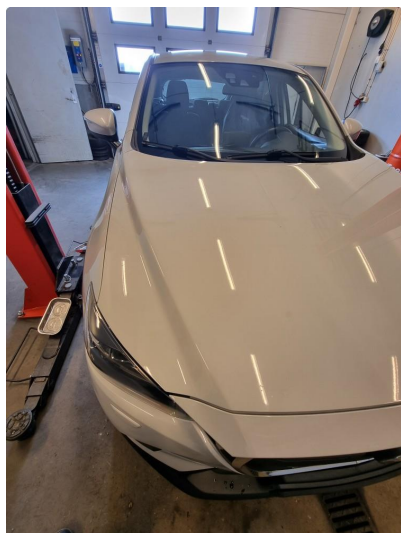
1.1 Mye stensprut