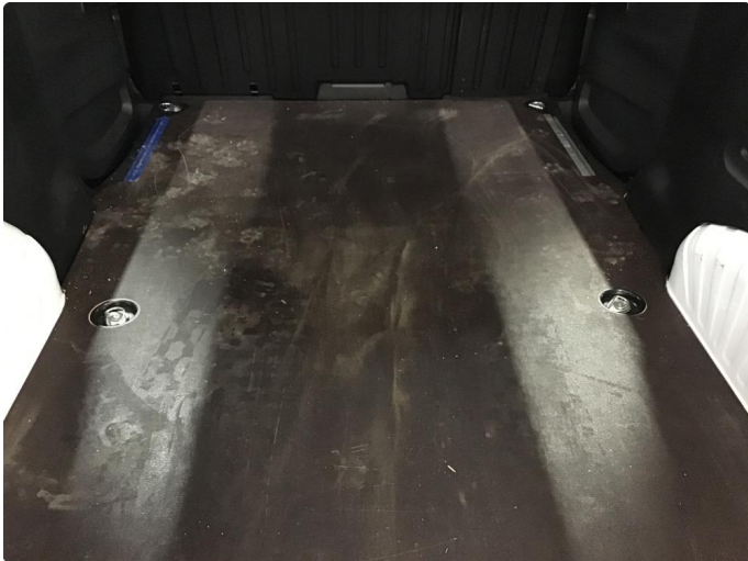
1.1 Kledning/gulv skadet