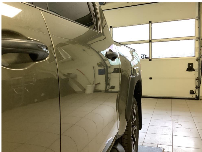
1.1 Liten bulk i dør