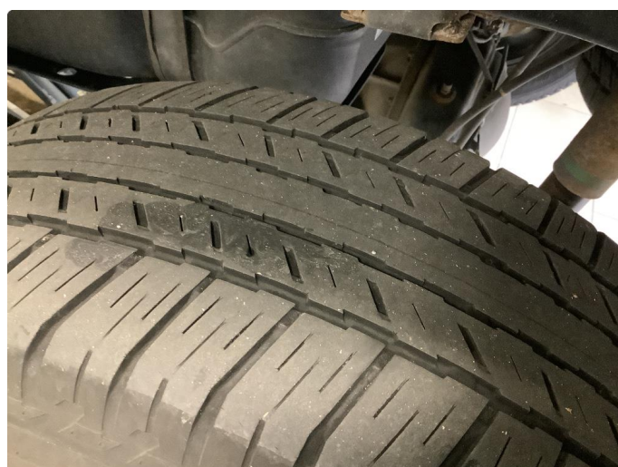
1.2 For liten mønsterdybde sommerdekk/ Slitte sommer Dekk CA 3 mm mitt på