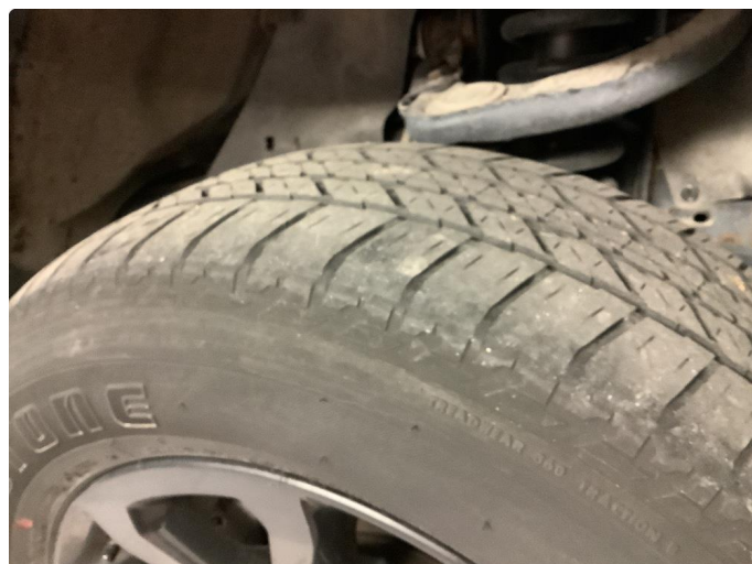
1.2 For liten mønsterdybde sommerdekk/ Slitte sommer Dekk CA 3 mm mitt på