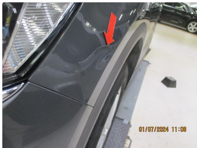
1.1 P-bulk venstre forskjerm.