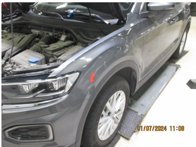
1.1 P-bulk venstre forskjerm.