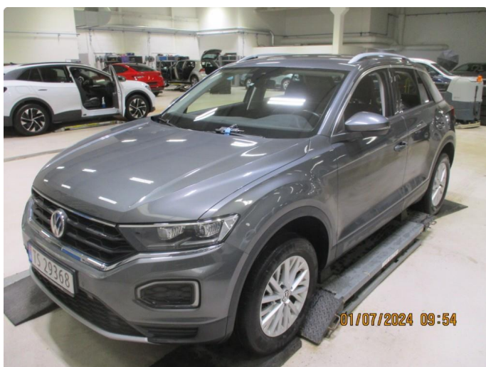
1.4 Frontrute + bakrute er slitt etter viskere.