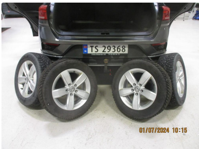
1.3 Kosmetiske sår på vinterfelger. Ok.