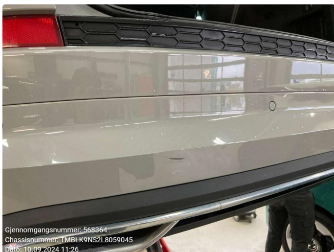
1.2 Ripe - pensles