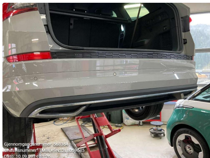
1.2 Ripe - pensles