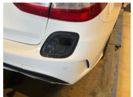
6. Ladekontakt elbil/hybrid