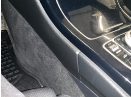
7. Dashbord / midtkonsoll