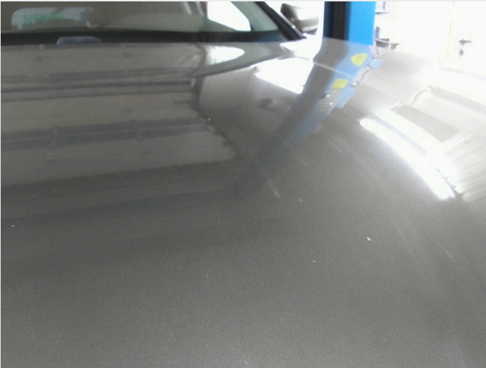
2.1 Noe mindre slitasje merker i lakk, ikke unormalt for alder