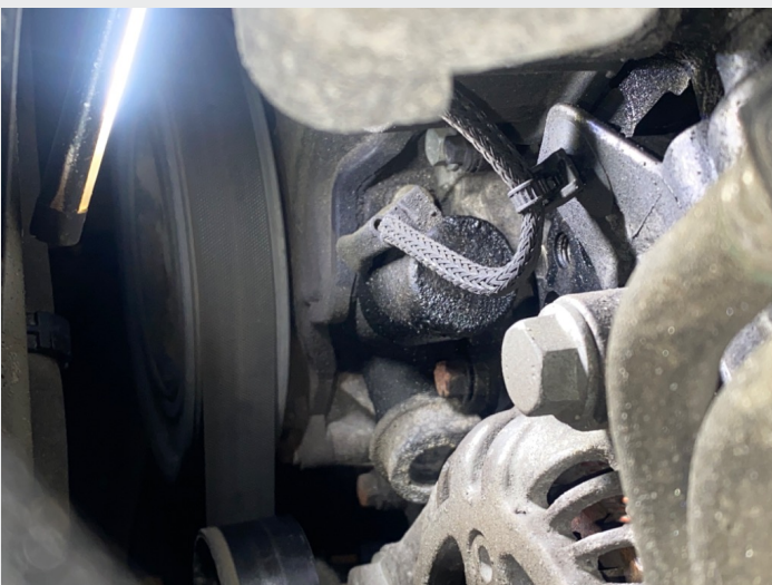
5.10 Ved register, vanskelig å ta bilde av