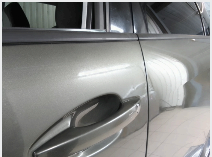
2.5 Bulk førerdør over håndtak