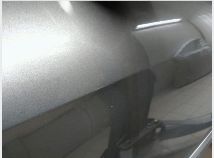
2.1 Noe mindre slitasje merker i lakk, ikke unormalt for alder