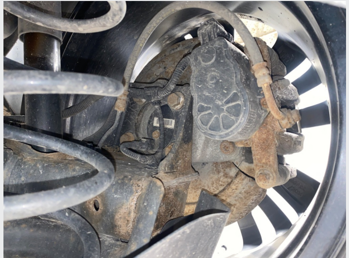
8.5 Noe rustet bakstilling, ikke unormalt for alder