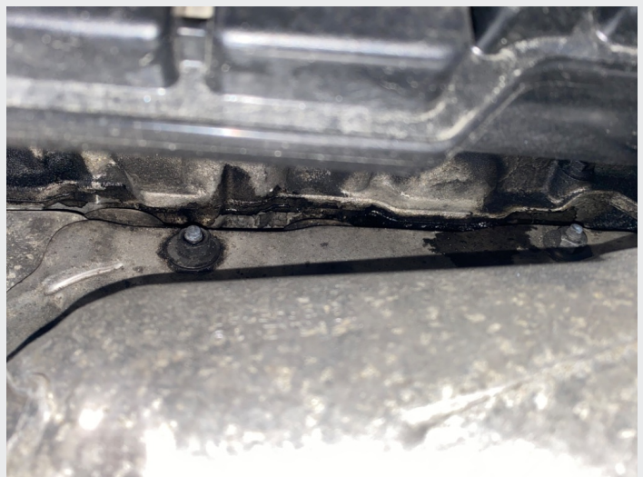
5.10 Ved toppdekselpakning