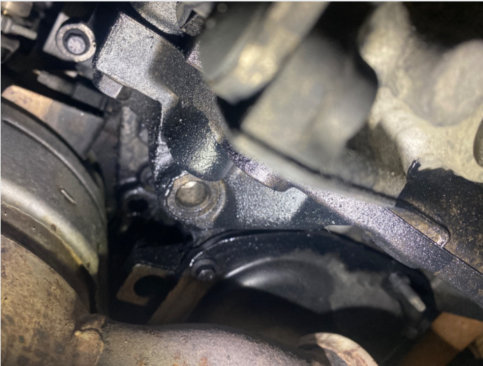
5.10 Under bil, ved bunnpanne