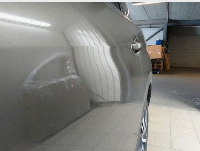
2.5 Liten bulk venstre bakdør