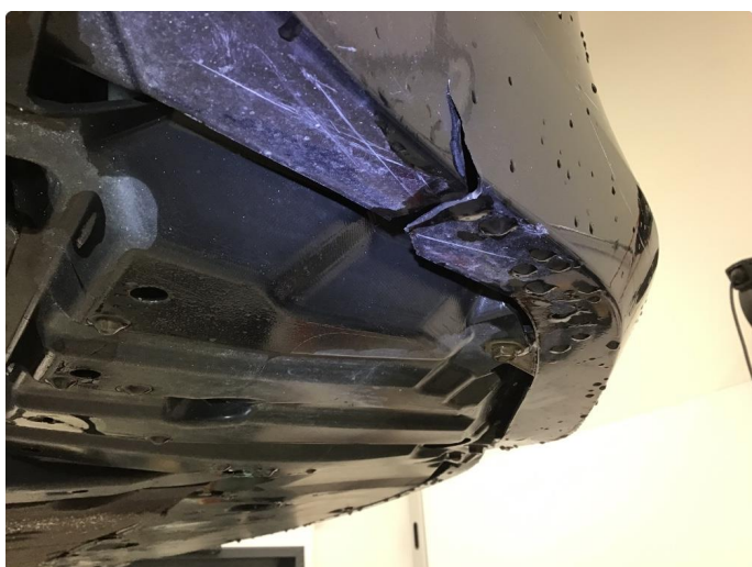
1.5 Ripe(r) ned til grunning