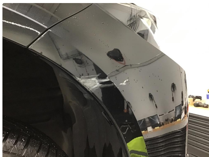
1.5 Ripe(r) ned til grunning