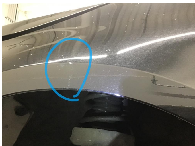
1.4 Ripe(r) ned til grunning