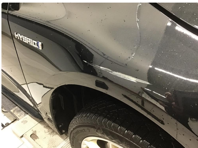
1.3 Ripe(r) ned til grunning