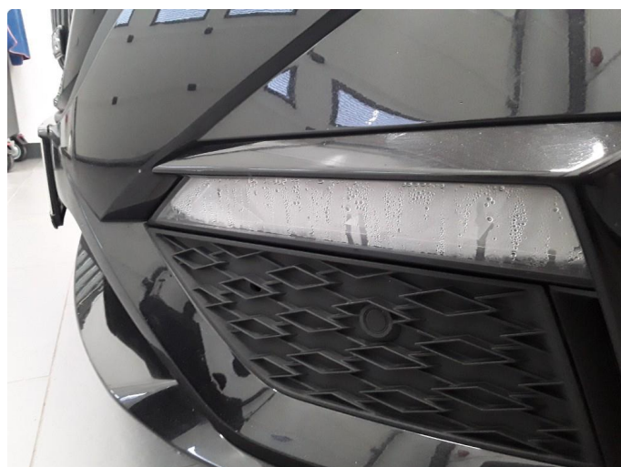
2.1 Dugg/fukt i tåkelys foran. Garantibehandles. Time bestilt.