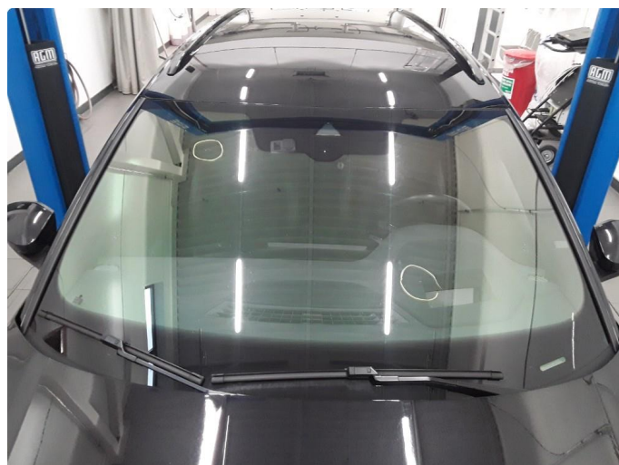
1.5 Noe steinslag i frontruten. Reparert og limt.