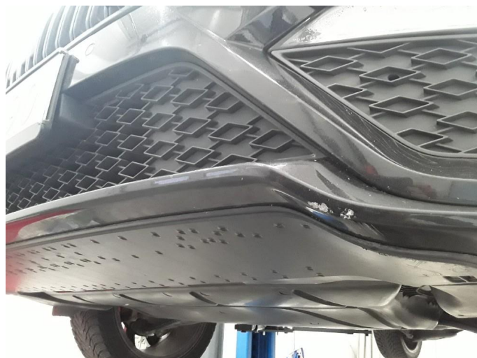
1.4 Noe skrubbskader underkant støtfanger foran.