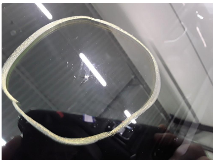
1.5 Noe steinslag i frontruten. Reparert og limt.