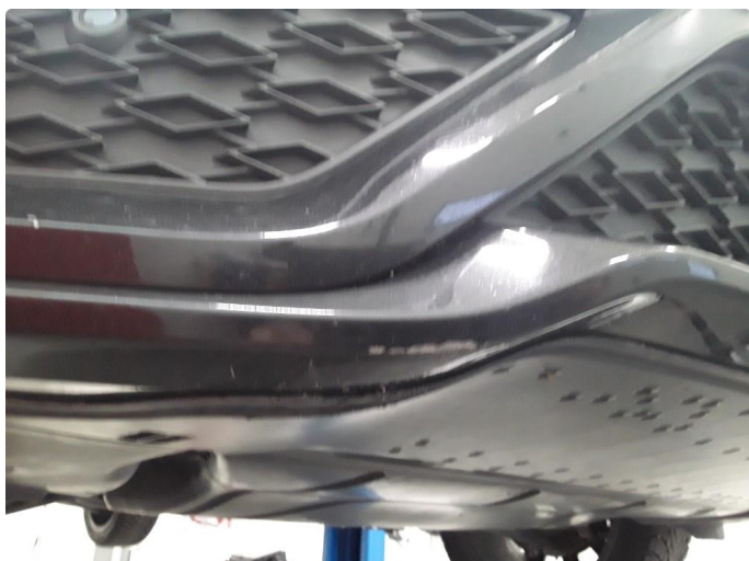
1.4 Noe skrubbskader underkant støtfanger foran.