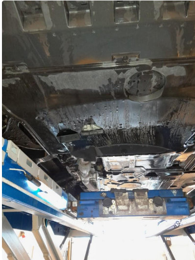
1.1 Ubetydelig liten del av plate nekt under bilen.