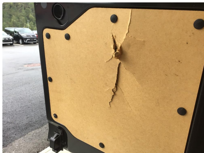
2.2 Kledning/gulv skadet