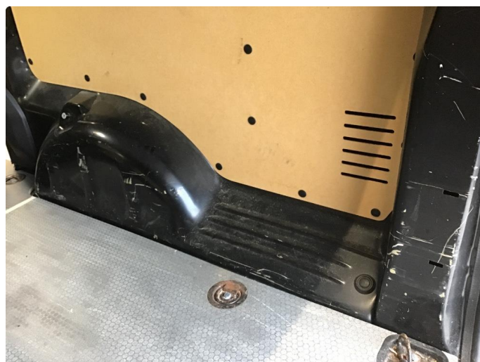
2.3 Generelt mye bulker/riper