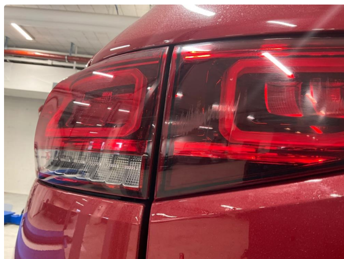
2.1 Noe småriper i lykteglass lysskinne bakluke v. side