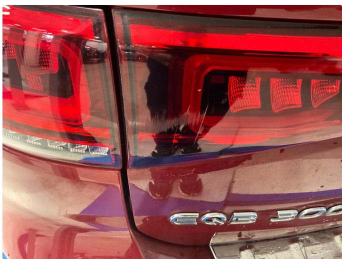
2.1 Noe småriper i lykteglass lysskinne bakluke v. side