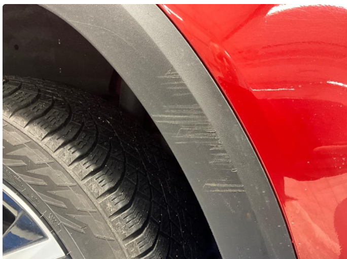
1.1 Noe riper i skjermbuelist v. side bak.