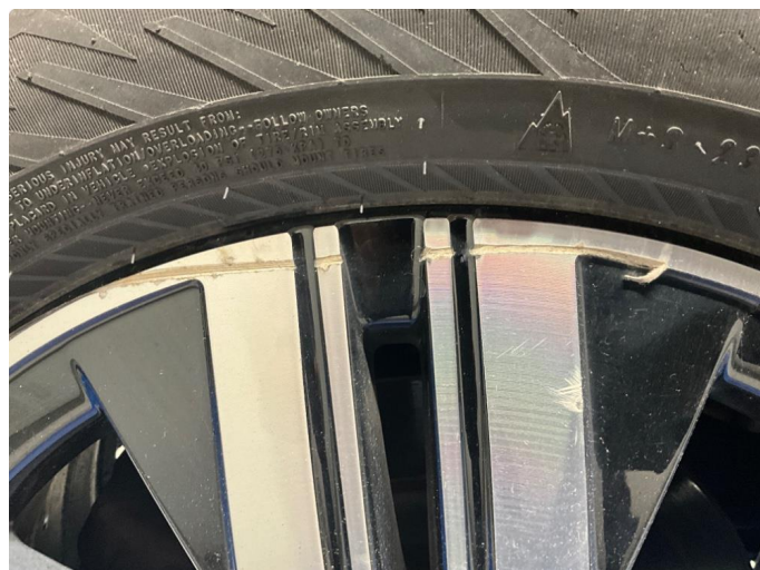
1.2 En vinterfelg kantkjørt