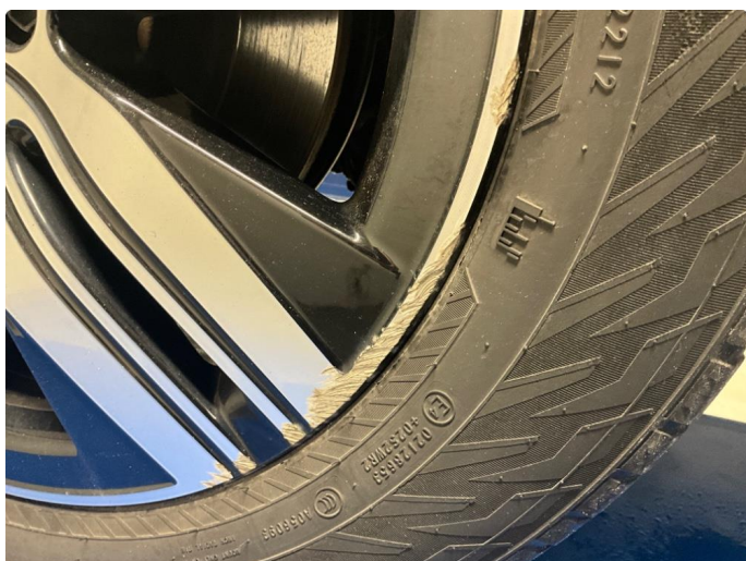
1.2 En vinterfelg kantkjørt