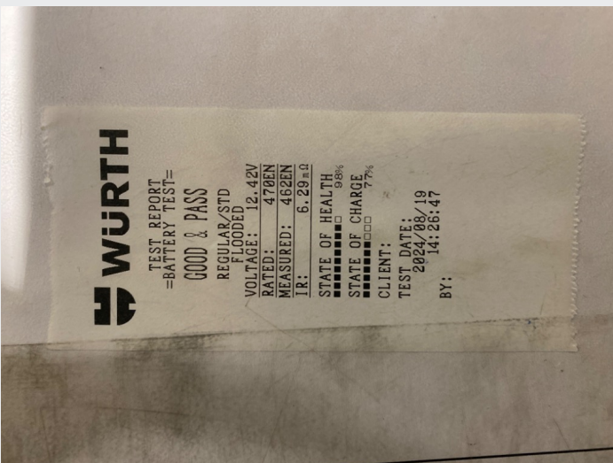
5.2 Batteritest ok