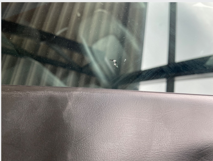
2.15 Mye steinsprut i frontrute