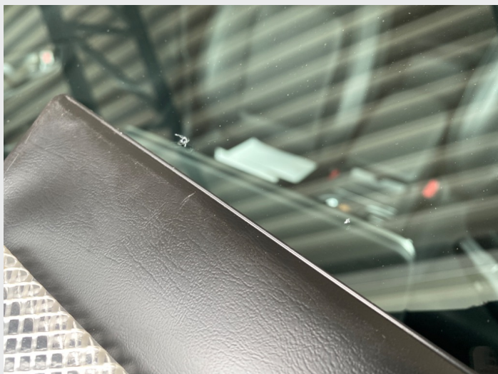
2.15 Mye steinsprut i frontrute