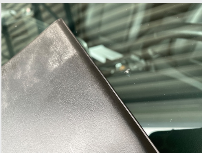
2.15 Mye steinsprut i frontrute