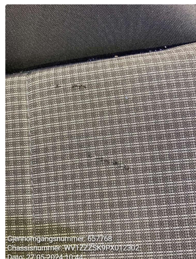
2.1 Skade på setepute