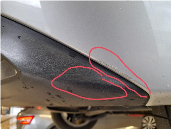
2.1 Ripe(r) ned til grunning