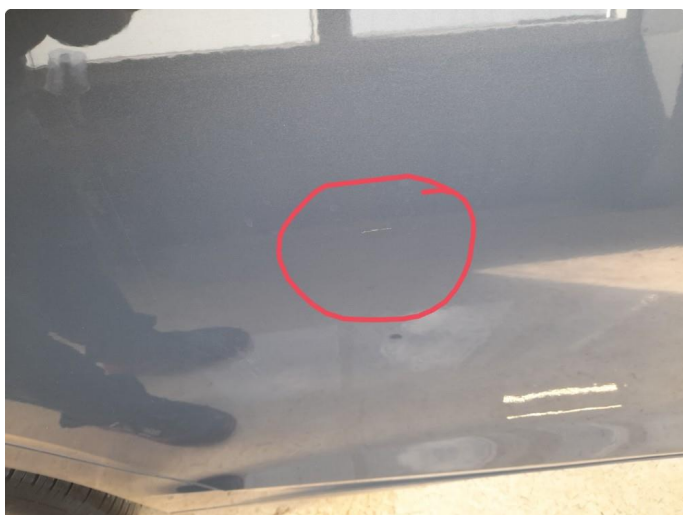
1.3 Ripe ned til grunning