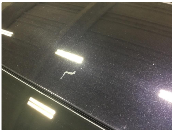
1.7 Noe steinsprut