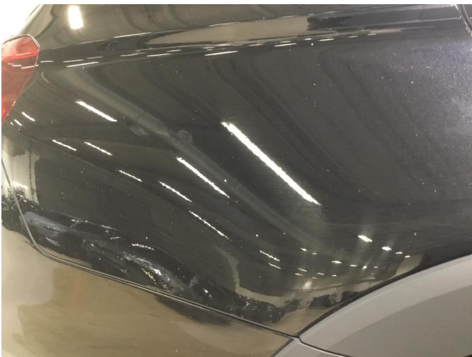
1.1 Høyre bakskjerm, bakfanger og bakluke - steinsprut/sår over hele panelen