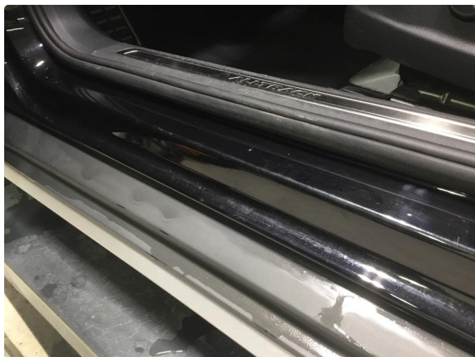
1.6 Noe slitte innsteg