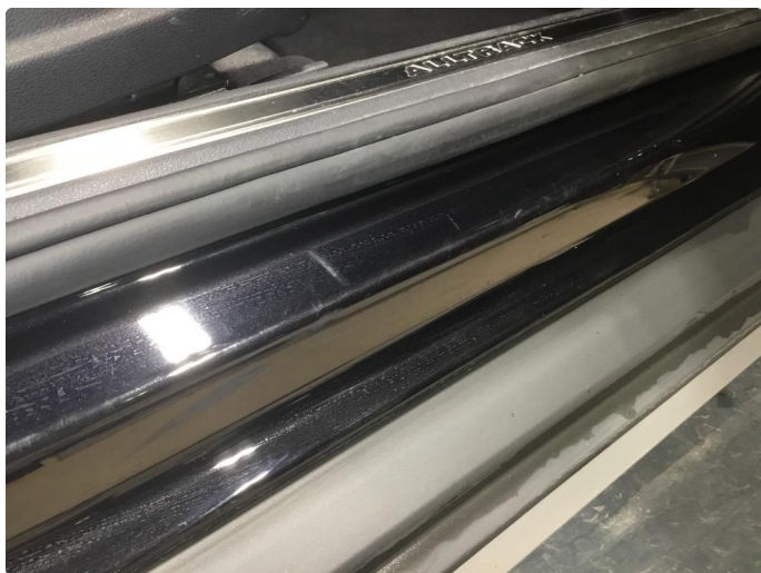
1.6 Noe slitte innsteg