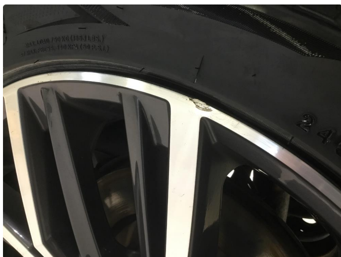
1.5 Sår i sommerfelg