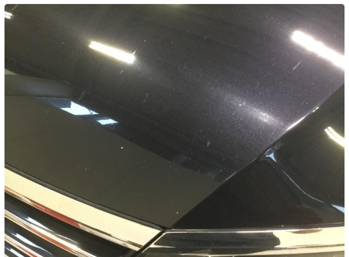
1.3 Steinsprut panser