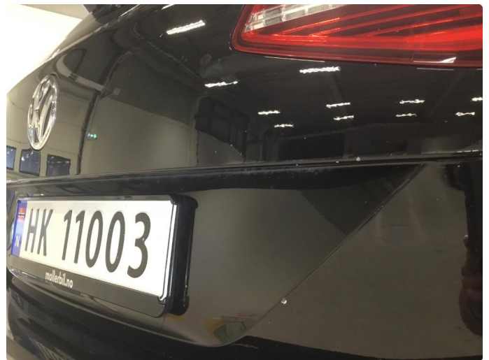
1.1 Høyre bakskjerm, bakfanger og bakluke - steinsprut/sår over hele panelen