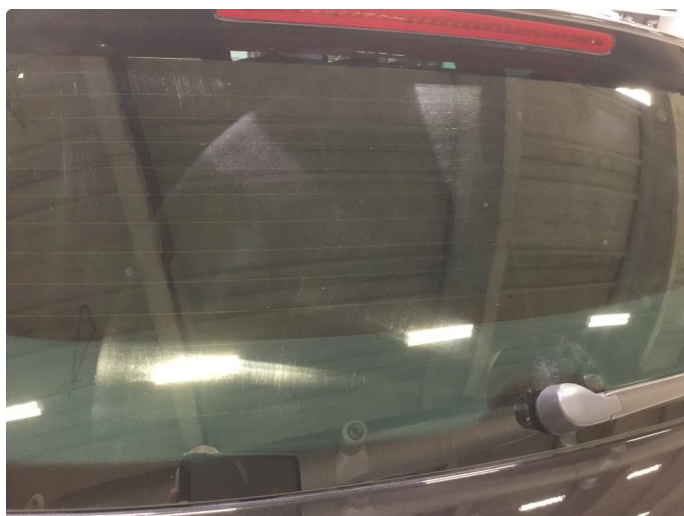
1.8 Litt Slitt bakvindu