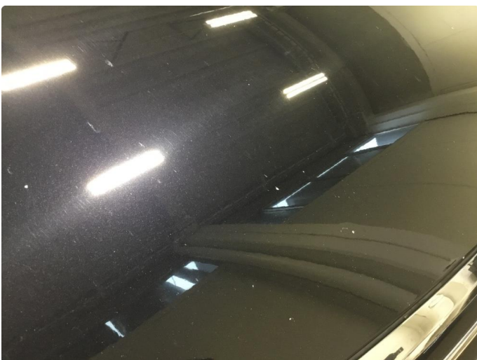
1.3 Steinsprut panser