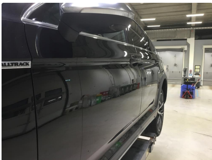
1.4 Venstre dør foran, P-BULK