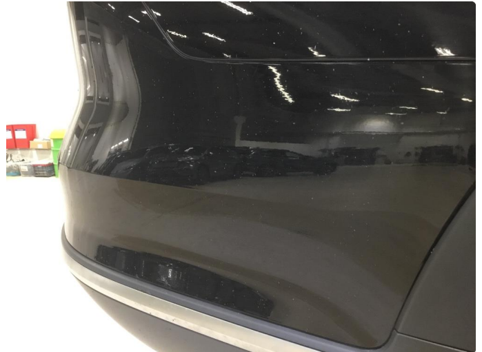
1.1 Høyre bakskjerm, bakfanger og bakluke - steinsprut/sår over hele panelen