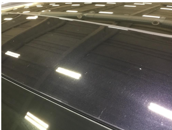
1.7 Noe steinsprut