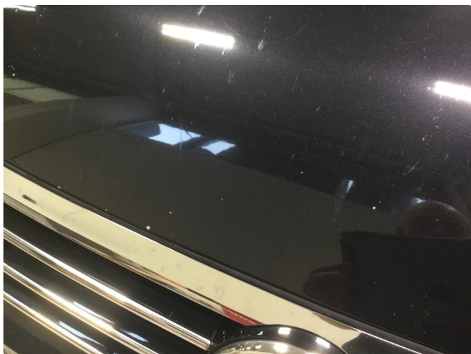
1.3 Steinsprut panser