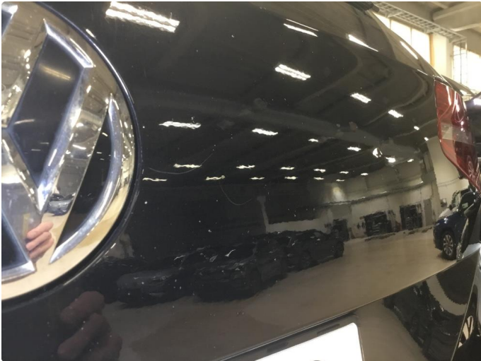
1.1 Høyre bakskjerm, bakfanger og bakluke - steinsprut/sår over hele panelen