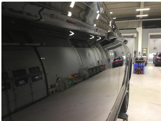
1.4 Venstre dør foran, P-BULK