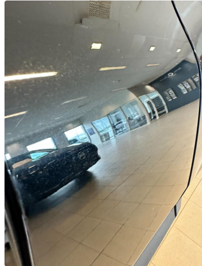
1.1 Liten ripe og bulk.