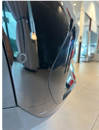
1.3 Små riper.