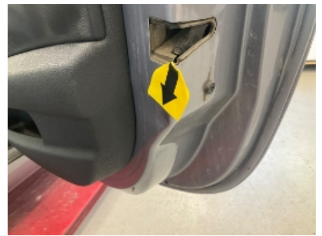
15. Lakk / karosseri utvendig