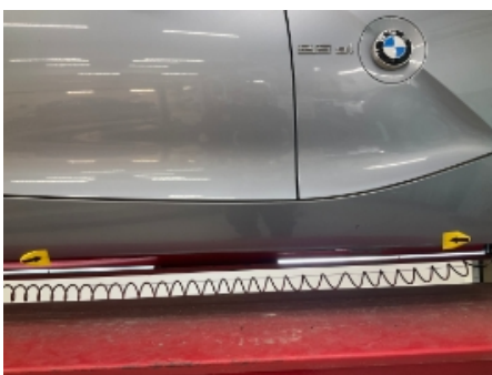
22. Lakk / karosseri utvendig