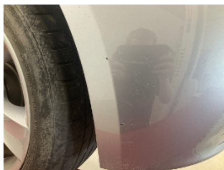
23. Lakk / karosseri utvendig