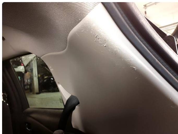
2.1 Bagasjeromsteppe skadet