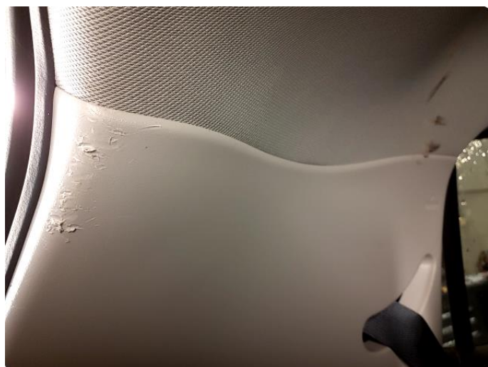
2.1 Bagasjeromsteppe skadet