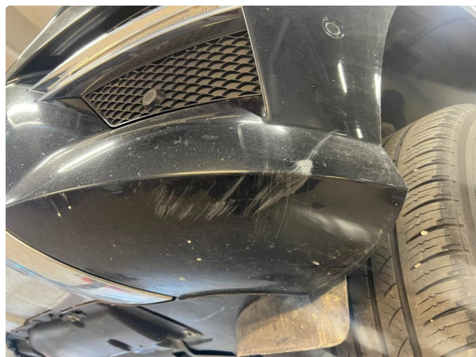
1.4 Skrubbskader underkant