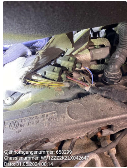
2.2 Øvrige feil