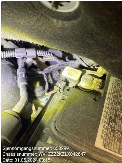
2.2 Øvrige feil