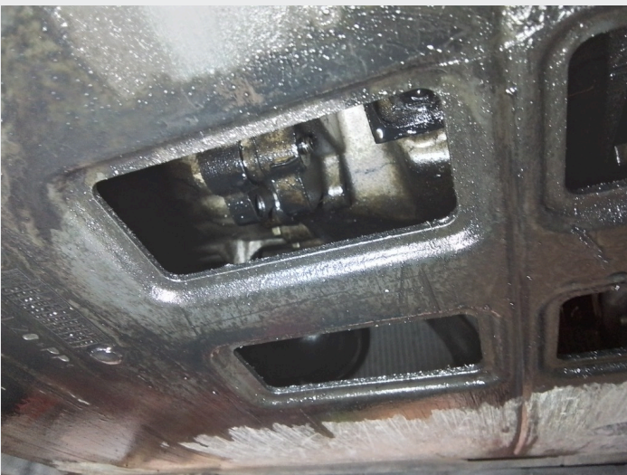
6.3 Oljesvetting bakkant motor. Anbefaler motorvask