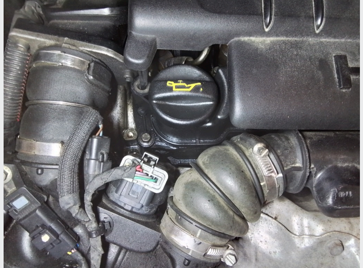
6.3 Svetting motor i henhold til bilens alder