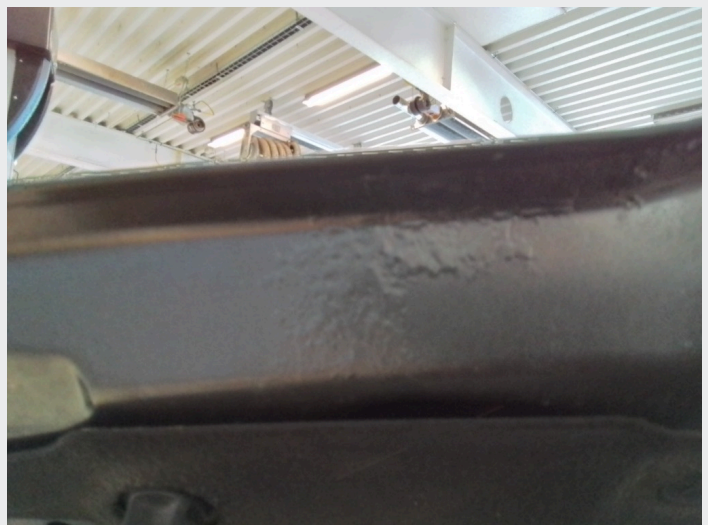
2.3 Rustbobler under panser