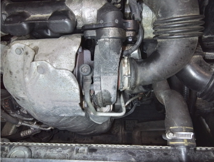
6.3 Svetting motor i henhold til bilens alder