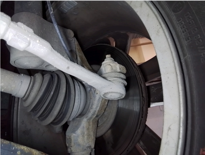
8.1 Slakke i ytre styrekule høyre side