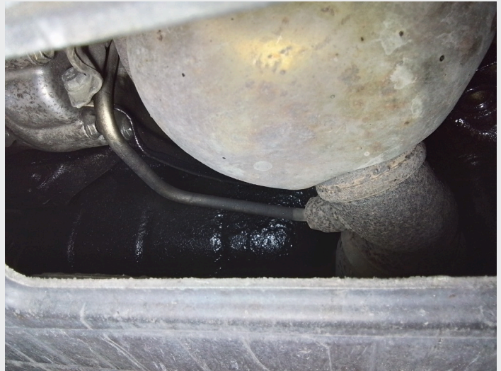
6.3 Oljesvetting bakkant motor. Anbefaler motorvask