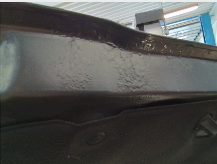
2.3 Rustbobler under panser