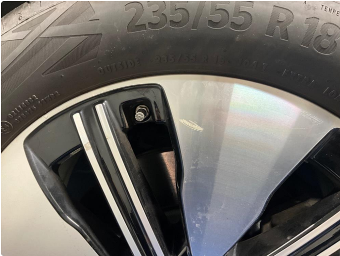
1.1 Liten ripe i en sommerfelg